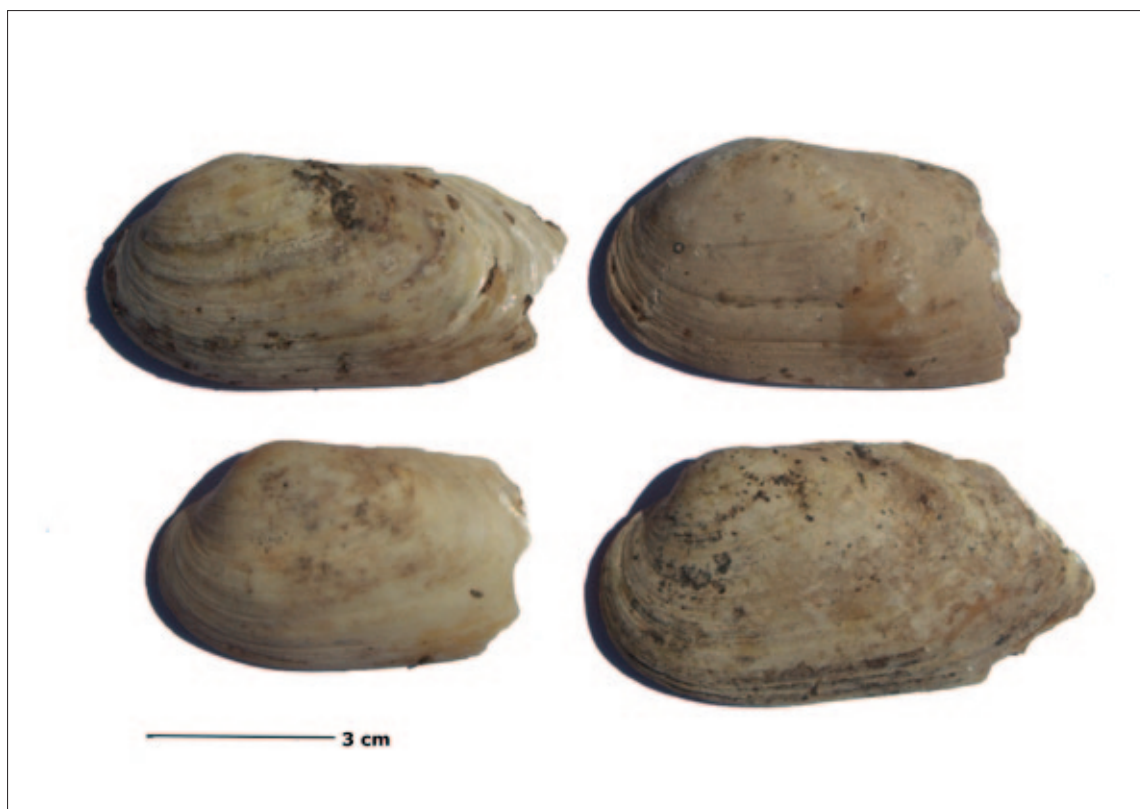
Sl. 1 Fragmentirane ljuštare školjakaša iz roda Unio (snimio: M. Marčelić)

Razlozi za povremeno iskorištavanje ovog slatkovodnog prirodnog resursa leže i u kakvoći mesa. Hranjenje filtriranjem čini ove školjakaše odličnim čistačima voda, no utječe na miris i okus mesa, kao i zdravstvenu ispravnost (Bauer, Wächter 2001). Dok U. pictorum i U. tumidus obitavaju u stajaćim vodama, U. crassus uglavnom preferira vode tekućice zbog čega njihovo meso može imati ugodniji okus i miris (Gulyás et al. 2007). Skupljanje preferirane vrste školjaka može biti vidljivo i u taksonomskom sastavu. U. crassus najzastupljeniji je školjakaš u Iloku sa 31,43 %, dok U. pictorum i U. tumidus zaostaju sa 14,28 %, odnosno 11,43 %. Sličan obrazac vidljiv je i drugdje. Na lokalitetu Eceşfalva 23, također je najzastupljeniji U. crassus (54 %), za razliku od U. pictorum (37 %) i U. tumidus (9 %) (Gulyás et al. 2007). Slična situacija je i u Vinči – Belom