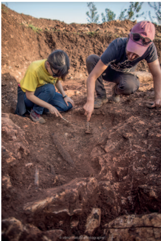
Sl. 3 Iskopavanje višestrukog paljevinskog ukopa u blizini crkve sv. Nikole u Starome Gradu

U kontekstu pitanja o prehrani, ekonomiji i paleokolišu Farosa i otoka Hvara, istovremeno se sustavno provodila i analiza životinjskih ostataka sisavaca i mekušaca, kao i karpološke analize biljnog materijala, sa svih gore spomenutih lokaliteta.