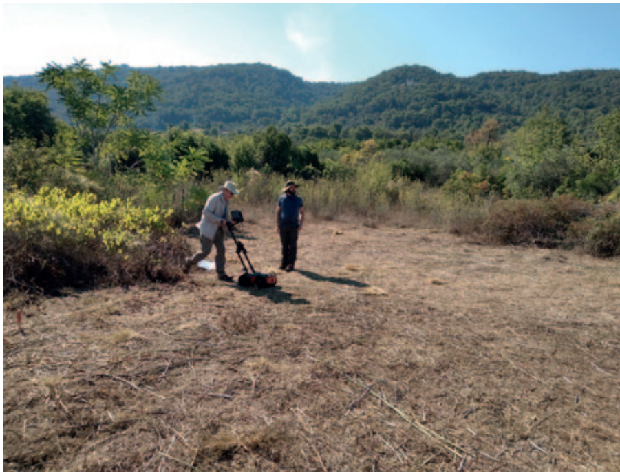
Sl. 2 Geofizička ispitivanja u okolici Staroga Grada Fig. 2 Geophysical research in the surroundings of Stari Grad