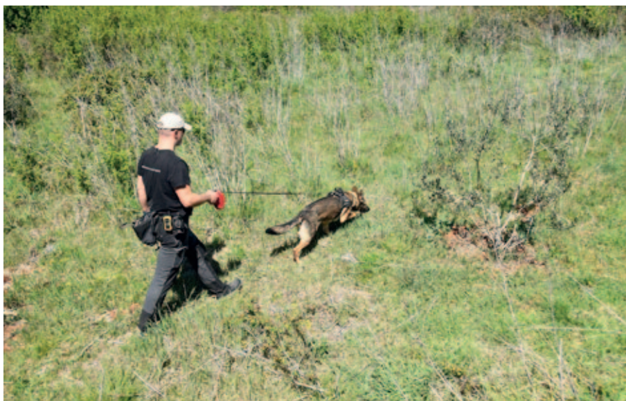
Sl. 1 Terenski pregled uz pomoć potražnog psa u okolici Staroga Grada

U potrazi za nekropolom grčkoga grada Fara, kao i nekropolom lokalne željeznodobne zajednice u gradu Hvaru, primijenjena je kombinirana, neinvazivna interdisciplinarna metodologija koja prethodno nije korištena na ovome prostoru. Nakon što su u GIS-u ucrtani svi dostupni podaci iz arhive, objava i terenskog pregleda, u suradnji s Odjelom za arheologiju Sveučilišta u Zadru, u travnju je na pomno selektiranim lokacijama proveden arheološki terenski pregled uz pomoć cadaver (HRD) pasa iz centra S.PAS (CCK9 Team). Radi se o psima istreniranim za detekciju ljudskih ostataka, odnosno za potragu, lociranje i označavanje mirisa ljudskih ostataka u različitim stupnjevima raspada i u različitim geološkim okruženjima, a koji se odnedavno uspješno koriste kao neinvazivna metoda u arheološkim istraživanjima (Glavaš, Pintar 2019). Od ukupno devet pregledanih lokacija na području Staroga Grada i Hvara, najviše pozitivnih rezultata, odnosno indicija, prikupljeno je na području iza crkve Sv. Nikole u Starome Gradu, na početku Starogradskog polja, s jedne i druge strane staroga puta prema Dolu, kao i na prostoru između Fortice i Kruvenice u Hvaru (sl. 1).