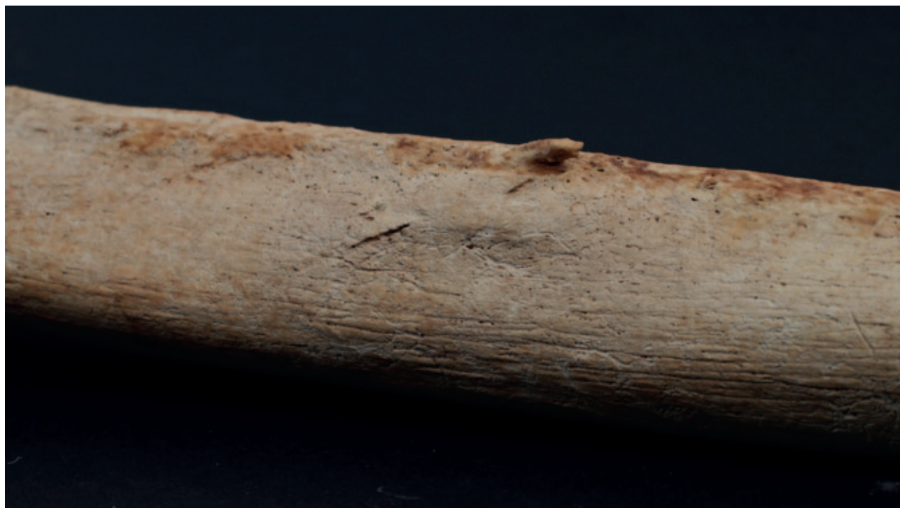
Sl. 1 Traumatski osificirajući miozitis na lijevoj bedrenoj kosti iz groba 12 Fig. 1 Myositis ossificans traumatica on the left femur from grave 12

Od pokazatelja subadultnog stresa (tab. 4 i 5) prikazane su učestalosti cribrae orbitaliae i ektokranijalne poroznosti. Cribra orbitalia je uočena na 50 % orbita djece starosti između jedne i pet godina (svi su slučajevi u zraslom obliku) te na svim pregledanim orbitama djece starosti između pete i desete godine života (od kojih je 25 % slučajeva u aktivnom obliku) što čini 75 % pregledanih dječjih orbita (od kojih je 16,7 % u aktivnom obliku). Kod odraslih, cribra orbitalia je uočena u 25 % pregledanih orbita (2/8), a svi zabilježeni slučajevi su u zraslom obliku. Kod žena, uočena je u 50 % pregledanih orbita (2/4), dok kod muškaraca cribra orbitalia nije evidentirana. Ektokranijalna poroznost uočena je na dvije od 12 sačuvanih lubanja (16,7 %), na lubanji odraslog muškarca i