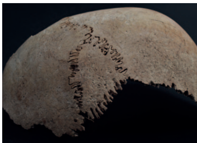
Sl. 2 Wormova kost na lubanji iz groba 17 Fig. 2 Wormian bone on the skull from grave 17

na lubanji djeteta starosti između 6,5 i 7,5 godina.