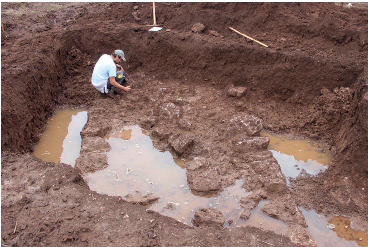
Sl. 2 Istraživanje fortifikacijske arhitekture u Starome Gradu Fig. 2 Excavation of the fortification architecture in Stari Grad

Manja iskopavanja, u suradnji s tvrtkom Kantharos d.o.o., bila su usmjerena i gradinu Vela Glava poviše Hvara, prethodno poznatu iz literature (Visković 2019: 12). Do sada istraživanja nisu vršena pa samim time nedostaju pouzdani kronološki i kulturološki podaci. Unutar dvije manje sonde na jugoistočnom i istočnom rubu gradine, potvrđen je plići sloj u kojemu su otkriveni isključivo prapovijesni pokretni nalazi, pretežno ulomci keramičkih posuda, no prikupljeni su i ostaci životinjskih kostiju i kućnog lijepa.