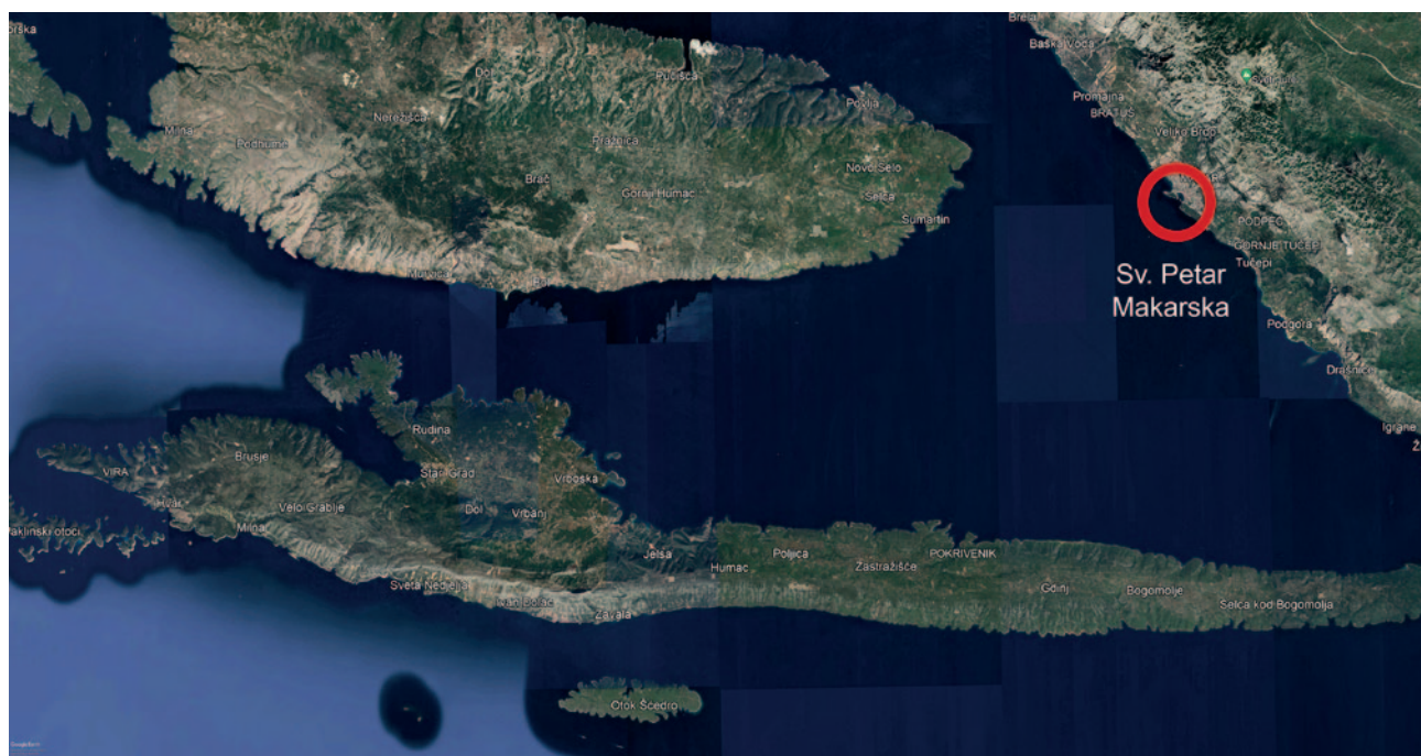
Karta 1 Položaj gradine Sv. Petar u Makarskoj u bračko-hvarskom akvatoriju (podloga: Google maps; računalna obrada: Dominik Glučina – Duplo više d.o.o.) Map 1 Location of the Sv. Petar hillfort in Makarska within the Brač–Hvar archipelago (base map: Google Maps; digital processing: Dominik Glučina – Duplo više d.o.o.)