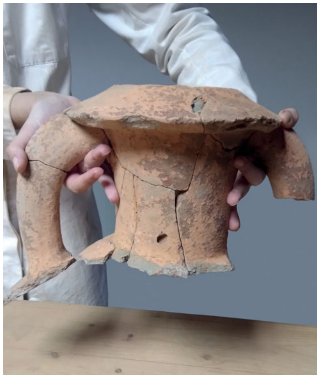
Sl. 3 Restauratorski radovi na amfori Korint A tipa Fig. 3 Restoration works on the Corinth A type amphora

Hvaru, u organizaciji Instituta za arheologiju i Muzeja Staroga Grada, uspješno je održan znanstveni skup Between Global and Local: Adriatic Connectivity from Protohistory to the Roman Period . Skup je bio hibridnog tipa; dio predavanja održavao se uživo a ostatak online . Kroz sudjelovanje preko 25 autora iz šest zemalja i tri kontinenta (Europe, Australije i Južne Amerike) predstavljene su zanimljive i značajne nove teme vezane uz Jadran u posljednjem tisućljeću pr. Kr.