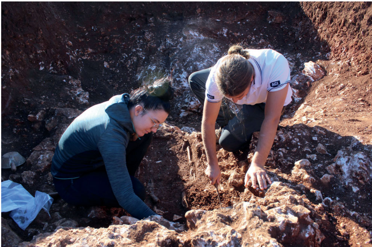
Sl. 1 Istraživanje nekropole u južnom dijelu Staroga Grada

Najvažnija otkrića, koja su na svjetlo dana iznijela terenska istraživanja, vežu se uz nove spoznaje o pogrebnim običajima i gradskom perimetru grada Fara. Nastavljeno je iskopavanje na području južno od antičkog Fara (predio Peča) gdje je prethodne godine otkriven i istražen grob s nalazima željeznog mača (kopisa) i koplja, kako bi se odredilo je li riječ o slučajnom nalazu ili lokaciji nekropole. Pronalazak dva nova ukopa u škrapu stijene i velikim dijelom in situ sačuvane amfore Korint A tipa, govori u prilog da je ipak riječ o funerarnom karakteru tog prostora, odnosno vjerojatno otkriću nekropole (sl. 1). Uz to, ovogodišnja probna iskopavanja usmjerena su po prvi put i na prostor bliže poznatom segmentu istočnog bedema grada Fara (istočno od lokaliteta Remete vrt), gdje su na svjetlo dana izašli tragovi monumentalne suhozidne arhitekture koja se preliminarno može povezati uz najraniju fortifikacijsku fazu Fara iz 4. st. pr. Kr. (sl. 2). Kraća iskopavanja provedena su i poviše Dominikanskog samostana, tik ispod mjesnog groblja, no na toj lokaciji nisu utvrđeni arheološki ostaci.