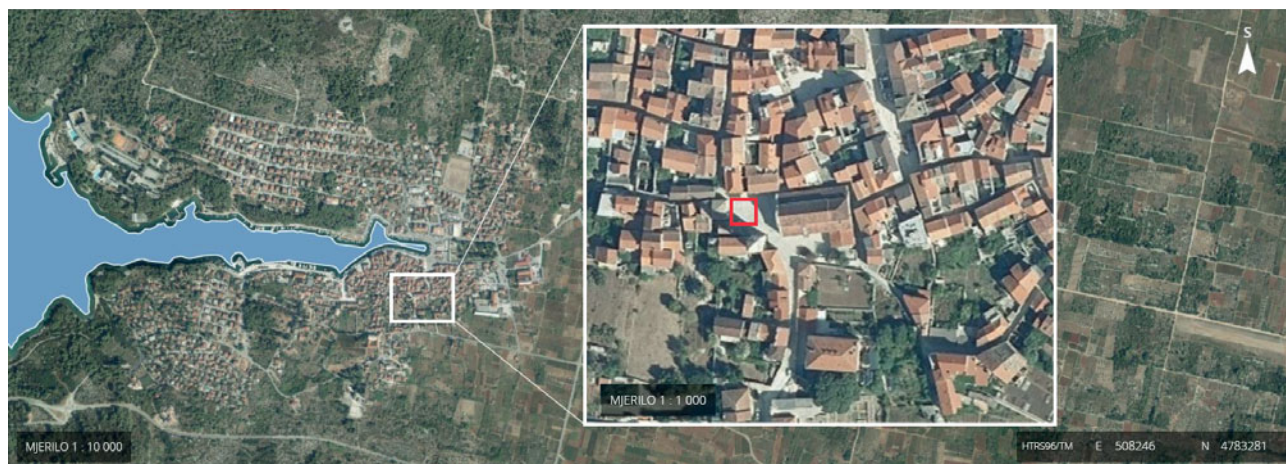
Sl. 1 Položaj sonde 11, u Starome Gradu (podloga: Geoportal DGU; računalna obrada: M. Korić) Fig. 1 Position of trench 11, in Stari Grad (base: Geoportal DGU; computer processing by: M. Korić)