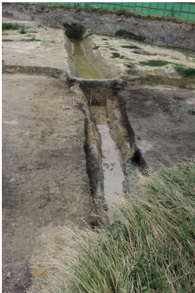
Sl. 2 Iskop kanala SJ 81 Fig. 2 Dugout of the canal SU 81

fortifikacijskog sustava Murse. U istočnom dijelu lokacije, gdje je bolja očuvanost antičkih slojeva, istraženi su ostaci objekta čija se funkcija može povezati s ostacima keramičarskih peći ovog položaja terena, kao i sjevernog dijela lokacije Građevinskog fakulteta (istražene u razdoblju 2006. – 2008.). Vjerojatno je riječ o pomoćnom objektu koji je bio povezan s keramičarskom proizvodnjom, odnosno o objektu u kojem su se keramički proizvodi izrađivali na lončarskom kolu, sušili, završno obrađivali i dekorirali.