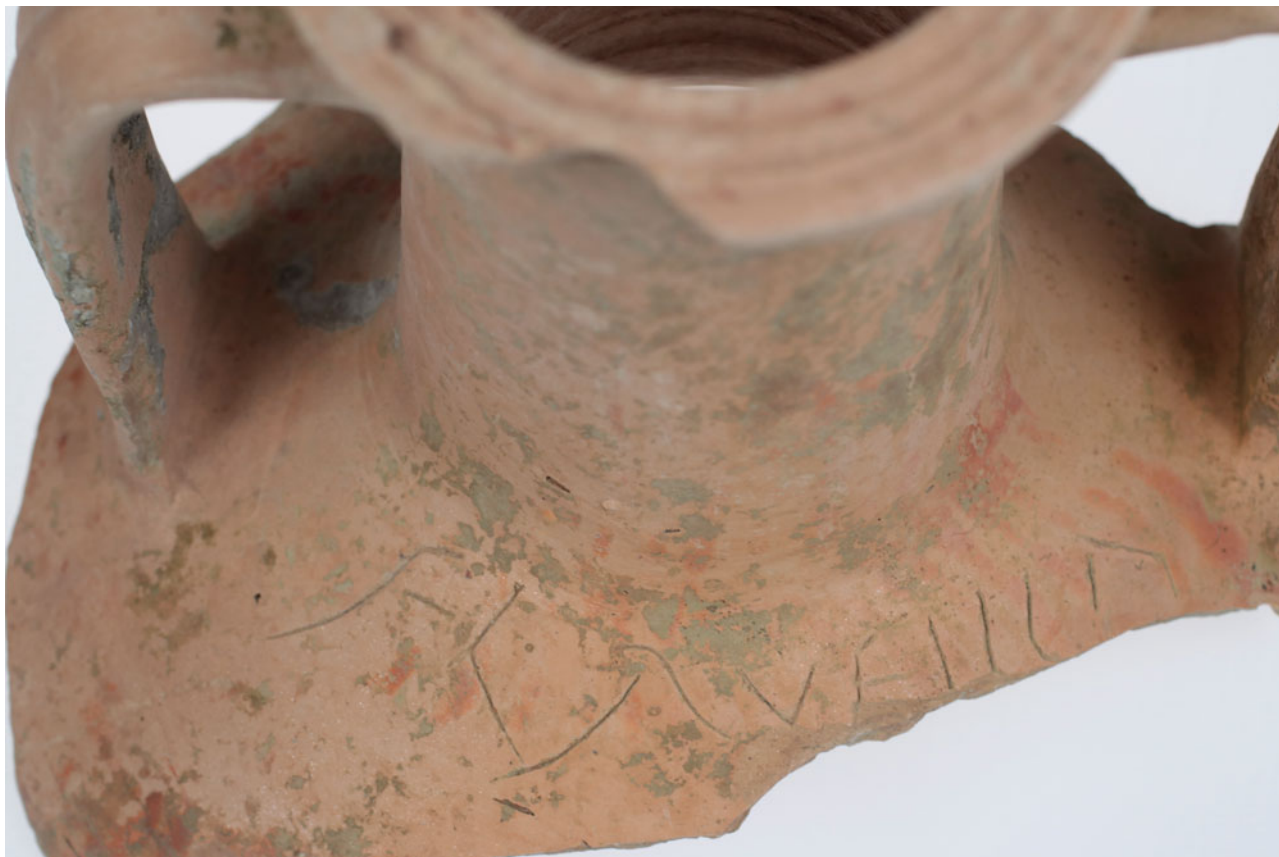
Sl. 4 Urezani natpis na amfori s lokaliteta Osijek – Vojarna – Pravni fakultet Fig. 4 Incised inscription on the amphora from the site Osijek – Barracks – Faculty of Law