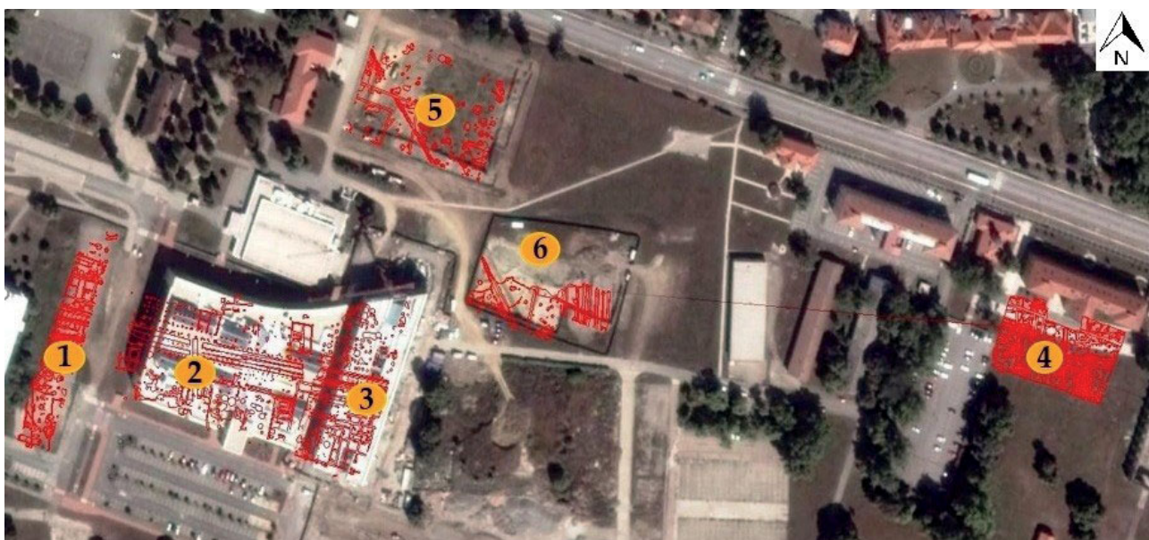
Sl. 1 Pozicije arheoloških istraživanja u osječkoj Vojarni 2001. – 2015.: 1 Studentski paviljon; 2 Poljoprivredni fakultet; 3 Građevinski fakultet; 4 Učiteljski fakultet; 5 Sveučilišna knjižnica; 6 Pravni fakultet (podloga: Geoportala DGU; izradili: S. Filipović, A. Bašić)