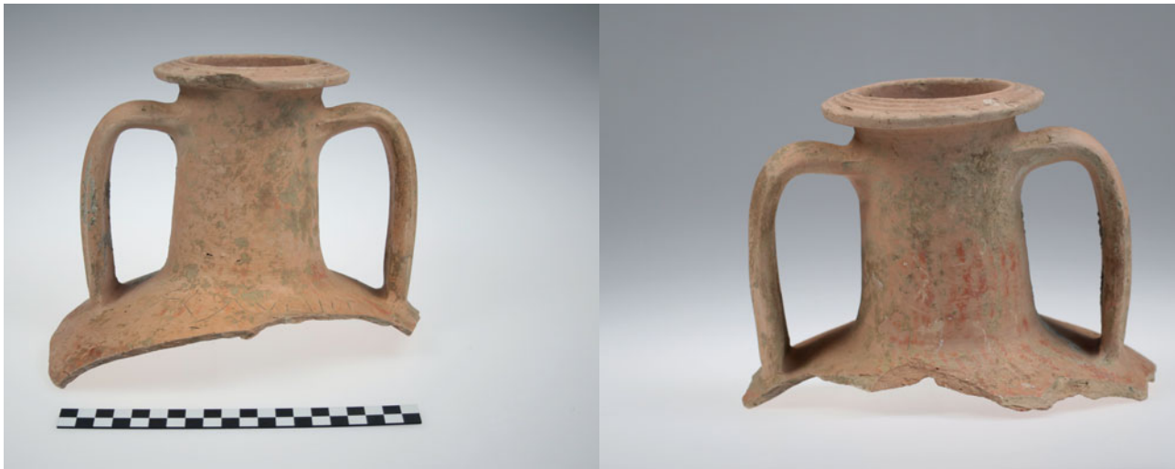
Sl. 3 Amfora s natpisom s lokaliteta Osijek – Vojarna – Pravni fakultet s prednje (a) i stražnje (b) strane Fig. 3 Amphora with inscription from the site Osijek – Barracks – Faculty of Law, front (a) and opposite (b) side