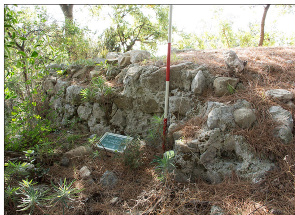
Sl. 4 Lokalitet 75 – apsida i sjeverni zid crkve sv. Marka (Banjol).

Dragi (LOK 71), koji se uglavnom tek naziru ispod bujnoga vegetacijskog pokrova (sl. 3), a mogla bi biti riječ o ostacima koje spominje B. Nedved (Nedved 1990: 27). Nedaleko od ruševina crkve sv. Marka u Banjolu (LOK 75), unutar manje gromače, uočeni su ostaci zidane strukture te nalazi koji također