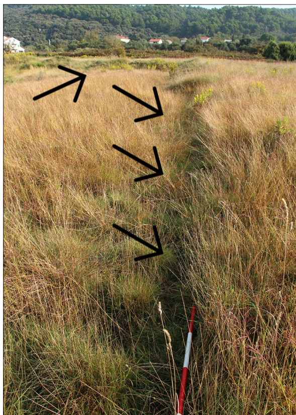
Sl. 3 Lokalitet 71 – obrisi struktura koje se naziru ispod vegetacije.