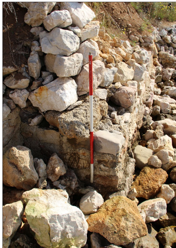
Sl. 2 Lokalitet 76 – antički zid na žalu uvala Valmartine.

Većim gospodarsko-rezidencijalnim kompleksima vjerojatno pripadaju i dva lokaliteta identificirana uz samu morsku obalu na području Barbata: LOK 74 – Mirine, i LOK 76 – Valmartina. Na potonjem su, osim evidentiranja zidanih struktura (sl. 2), prikupljeni i nalazi koji upućuju na kasnoantičku dataciju, a nedaleko od ovih lokaliteta, na lokalitetu Pudarica (LOK 77), zamijećeni su i grobovi istovjetne datacije. Na sličan bismo način mogli interpretirati i tragove arhitekture zamijećene istočno od crkveno-samostanskog kompleksa sv. Petra u Supetarskom