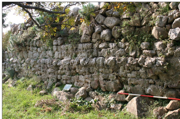
Sl. 1 Lokalitet 70, struktura 1 – elevacija zida od lomljenaca vezanih žbukom na kojeg je „dograđen“ suhozid (snimila: A. Konestra).

Kao novevidentirani lokaliteti svakako se ističu LOK 70 (sv. Anastazije – Za Markovićem) na kojem je utvrđena zidna struktura koja je u svom donjem dijelu građena od lomljenaca