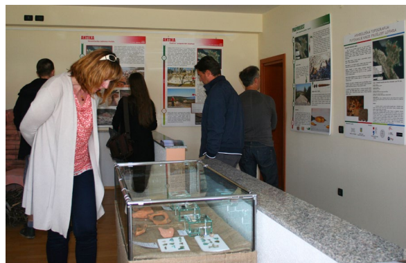
Sl. 7 S otvorenja izložbe „Arheološka topografija: putovanje kroz prošlost Lopara“.