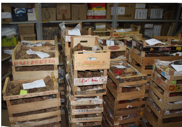
Sl. 3 Skladište s materijalom – dio kašeta opranih 2014. godine pohranjenih nakon sušenja.

Fig. 2 Situation on the field in September 2014.