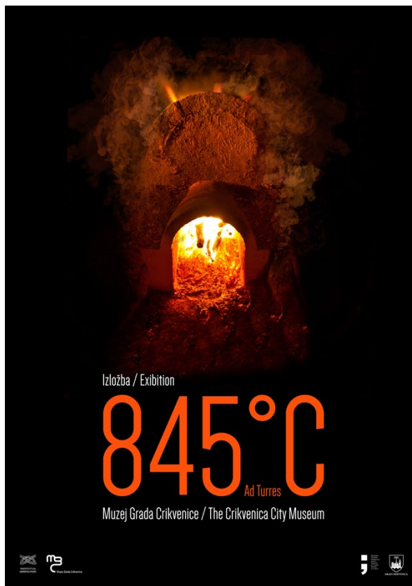
Sl. 5 Plakat izložbe 845°C Ad turres (izradio: B. Crnić).

Fig. 5 845°C Ad Turres exhibition poster (design by: B. Crnić).