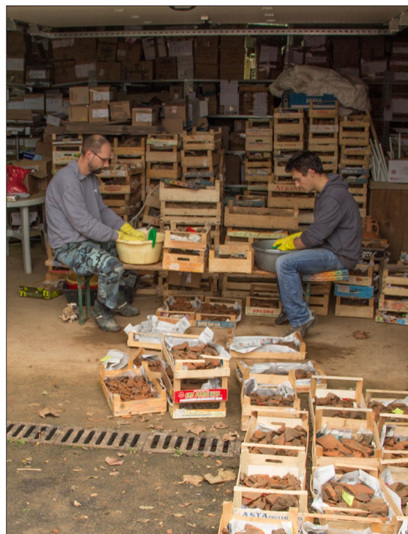
Sl. 4 Tim perača tijekom pranja keramike.

Predstavljanjem nalaza sa širega crikveničko-vinodolskog područja te posebice s lokaliteta Igralište, uz posudbu građe iz Arheološkog muzeja u Zagrebu, Povijesnog i pomorskog muzeja Hrvatskog primorja u Rijeci te privatnih zbirki, na izložbi je prezentiran pregled arheološke baštine od brončanog doba do kasne antike, uz poseban osvrt na potpadanje ovog prostora u sferu rimskog utjecaja te uspostavu radionice Seksta Metilija Maksima. Proizvodni proces keramičarske radionice, njezin asortiman i njegova distribucija čine drugi dio izložbenog postava (sl. 6), s osvrtom na importiranu građu sa širega kvarnerskog područja koja je cirkulirala uz crikveničke proizvode. Bogatim ilustracijama, rekonstrukcijama ali i samim nalazima pokušalo se široj publici približiti specifičnosti lokaliteta keramičarske radionice u širem regionalnom kontekstu, dok se putem multimedijalnih alata predstavila 3D rekonstrukcija radionice i sam proces iskopavanja lokaliteta. Osvrt na kasnoantičko razdoblje koje karakterizira zamiranje radionice te drugačiji oblik korištenja toga prostora, ali također i očitije korištenje povišenih položaja vinodolske doline, zaključuje izložbu i rimskodobnu priču Crikvenice i njezina zaleđa. Izložbu prati dvojezični letak s fotografijama i kratkim tekstom, dok je katalog u pripremi.