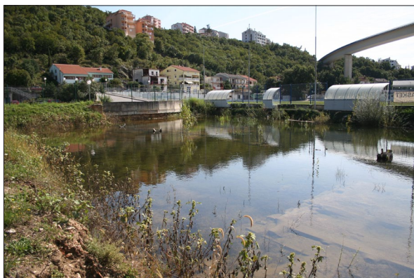
Sl. 2 Situacija na terenu u rujnu 2014..

Fig. 1 Area flooded in the summer of 2014.