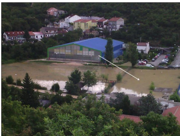
Sl. 1 Poplavljeno područje u ljetnim mjesecima 2014. godine.

Fig. 1 Area flooded in the summer of 2014.