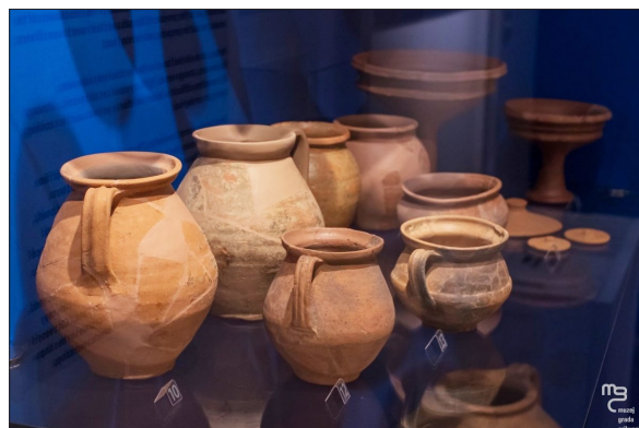
Sl. 6 Crikvenički asortiman posuda predstavljen na izložbi 845°C Ad turres.

Fig. 5 845°C Ad Turres exhibition poster (design by: B. Crnić).