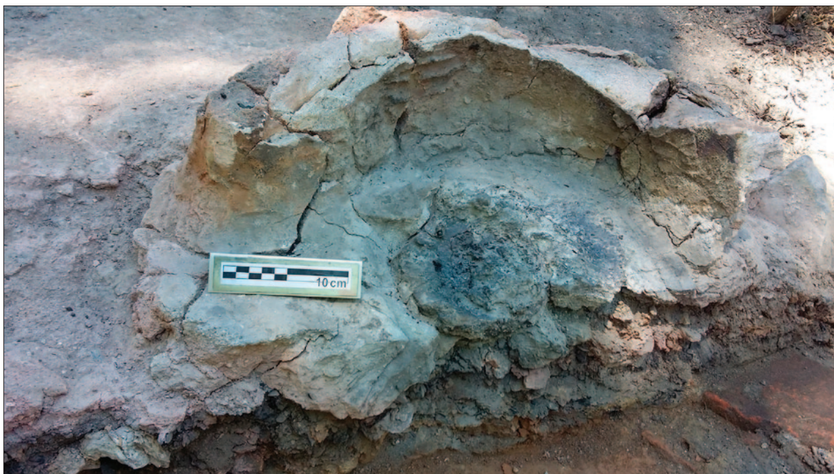
Sl. 6 Jako zapečeno zdjelicaasto dno ložišta peći, tzv. „zdjelica“