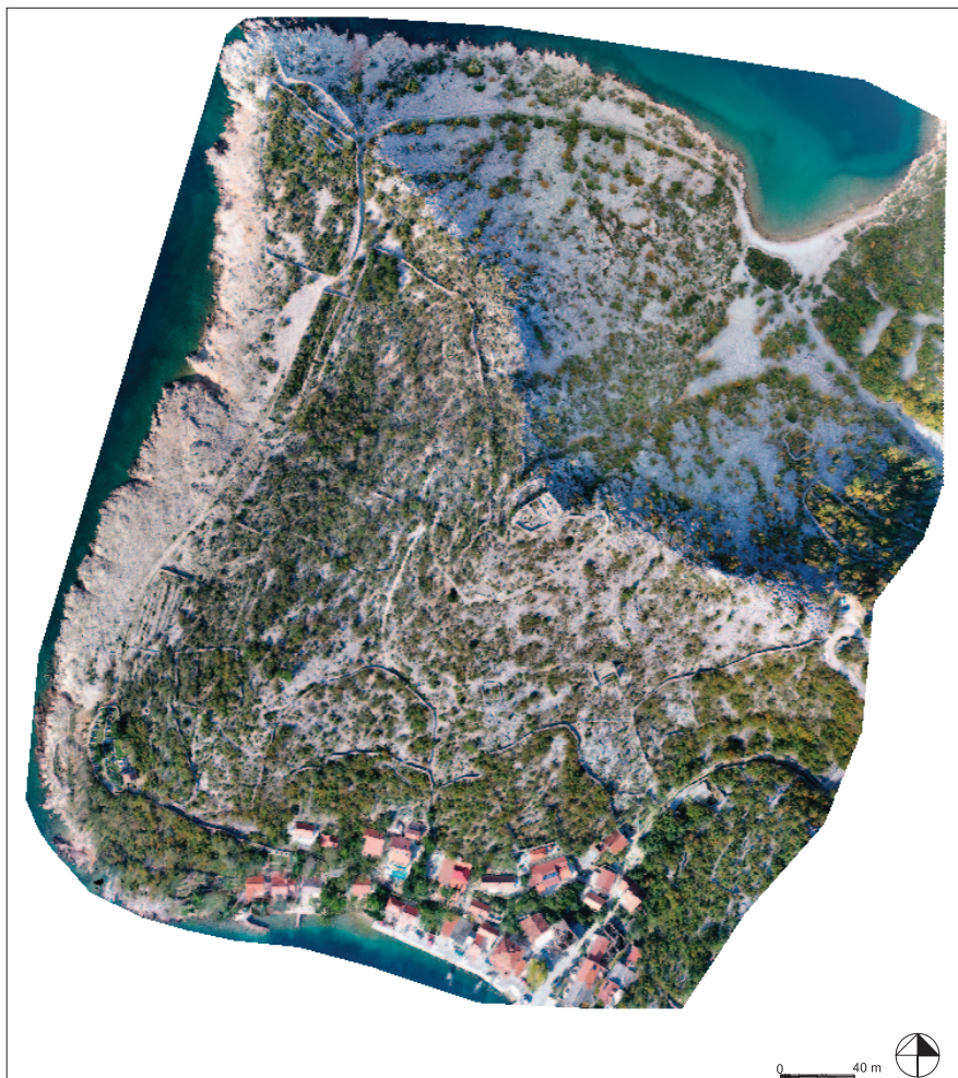
Sl. 4 Ortofoto snimak Starigrada Senjskog

Fig. 3 Hillfort near Prizna – orthophoto with marked visible structures (drawing: A. Konestra)