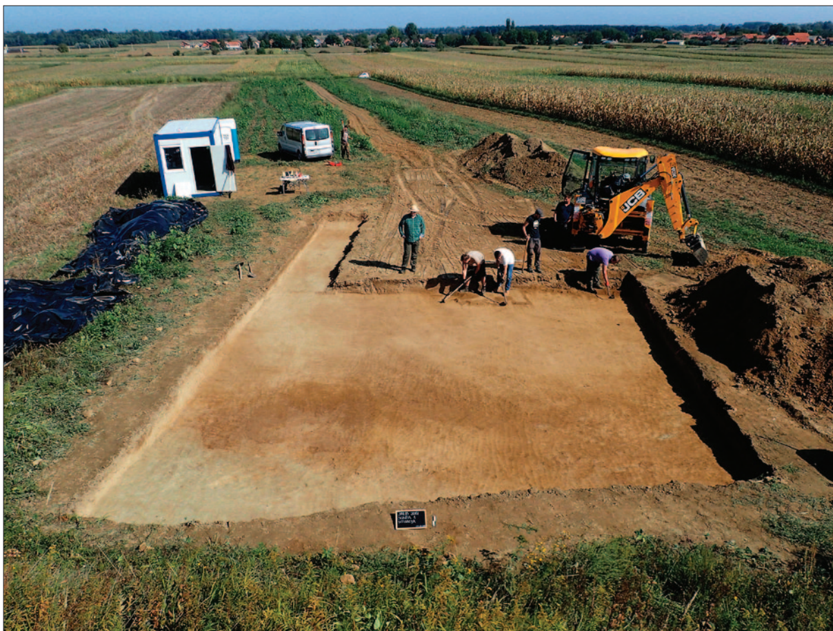
Sl. 1 Pogled na sondu 1 tijekom istraživanja 2017. godine