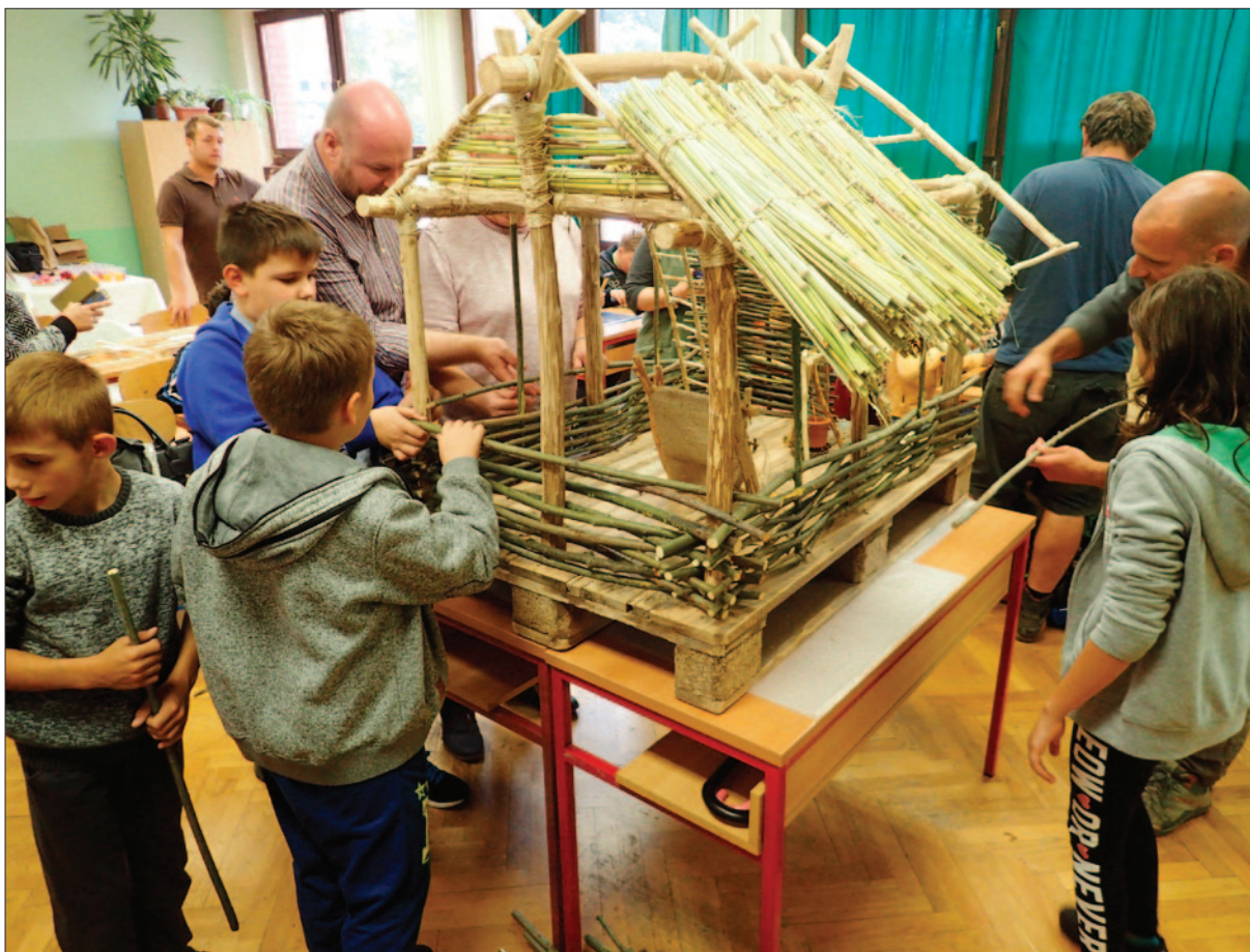
Sl. 3 Provedba arheoloških školskih radionica tijekom Kampa Hrvatska, projekta „Iron-Age-Danube“