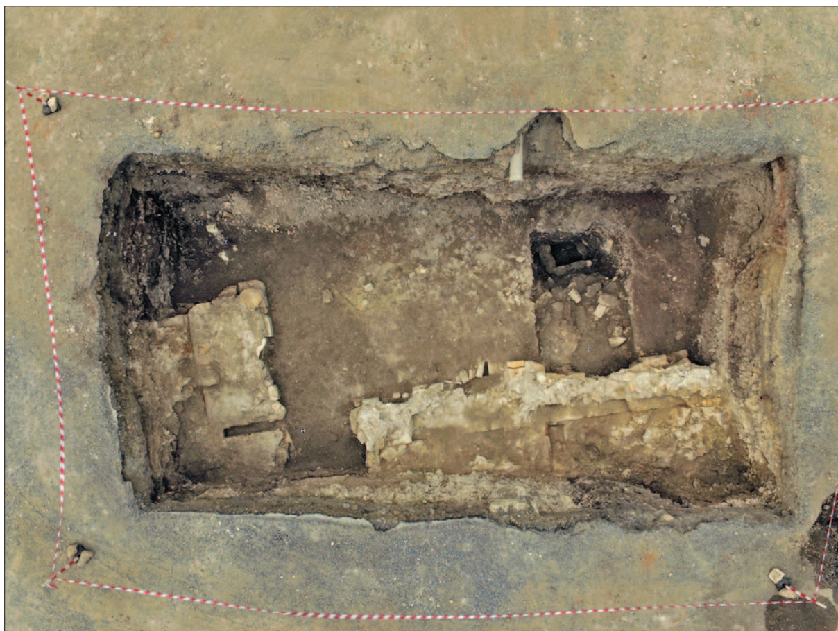
Sl. 2 Sonda 1 – završna orto fotografija

Fig. 1 Probe 1 – the remains of the structure built of cut stones