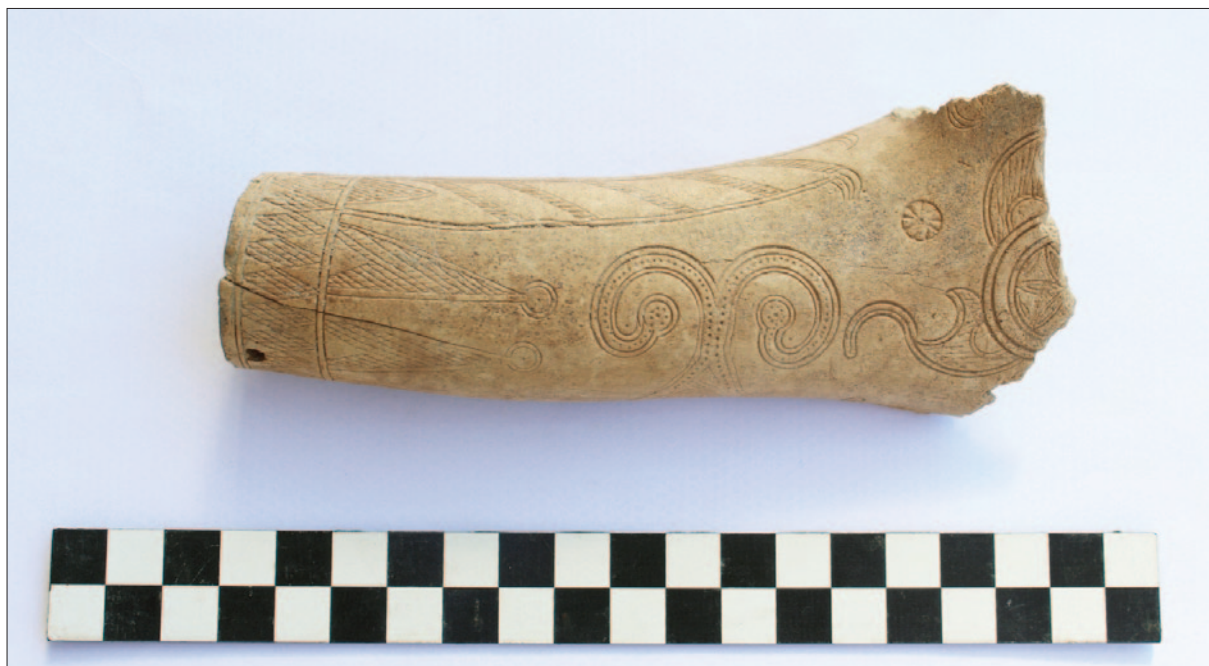
Sl. 9 PN 004 – koštani recipijent za barut Fig. 9 SF 004 – gunpowder holder made of bone