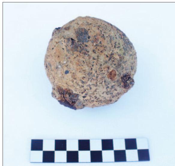
Sl. 8 PN 015 – željezna kugla, dio buzdovana Fig. 8 SF 015 – iron head of a mace