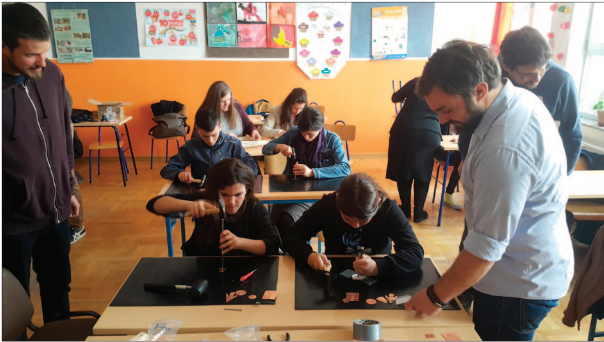
Sl. 2 Izvedba arheološke školske radionice u OŠ Vladimira Nazora u Novoj Bukovici 2017. godine

Fig. 2 Archaeological school workshop performance in ES Vladimir Nazor in Nova Bukovica in 2017