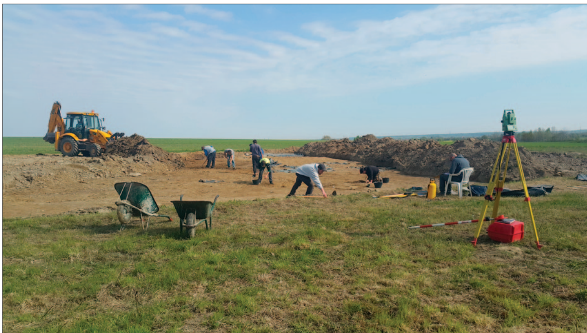
Sl. 1 Sonda 2017. godine tijekom arheoloških istraživanja

Fig. 1 Probe during the archaeological research in 2017