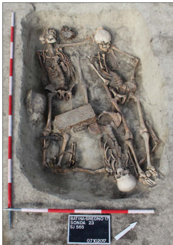
Sl. 3 Ukop vojnika s kraja II. svjetskoga rata

U istočnome dijelu sonde, u većoj pravokutnoj grobnoj jami, pronađeni su posmrtni ostaci tri vojnika s kraja II. svjetskoga rata uz koje su još pronađeni veća količina osobnoga naoružanja i streljiva, zatim osobni predmeti te dijelovi uniformi (sl. 3). Poginuli vojnici vjerojatno su pokopani na Srednom tijekom Batinske bitke koja se odvijala u studenome 1944. godine, a s kojom se mogu povezati i brojni nalazi naoružanja i streljiva koji su pronađeni tijekom istraživanja tumula 1 i 2 smještenih na samome sjevernom rubu položaja Sredno, neposredno uz surduk koji je Sredno dijelio od naselja na Gracu. Ostale dokumentirane cijeline u sondi 21 nisu sadržavale nalaze te ih nije moguće uže kronološki odrediti, iako sustavi ka-