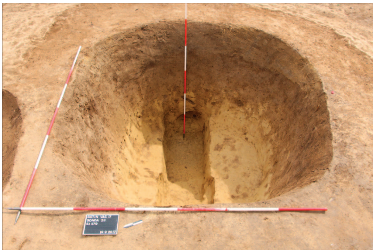
Sl. 7 Podrum SJ 1179