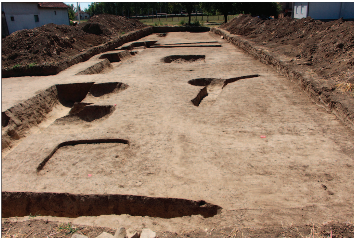
Sl. 1 Istražena sonda 23 – pogled sa sjevera