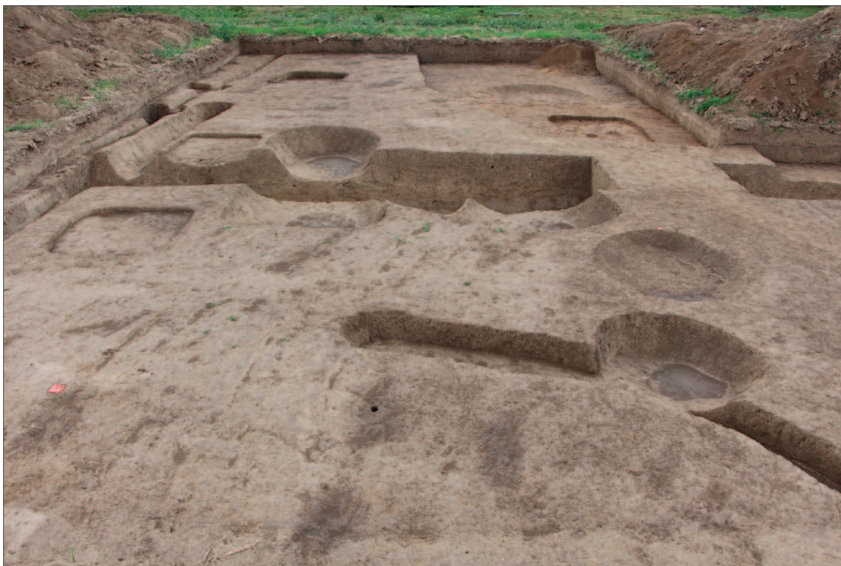
Sl. 2 Istražena sonda 24 – pogled sa zapada