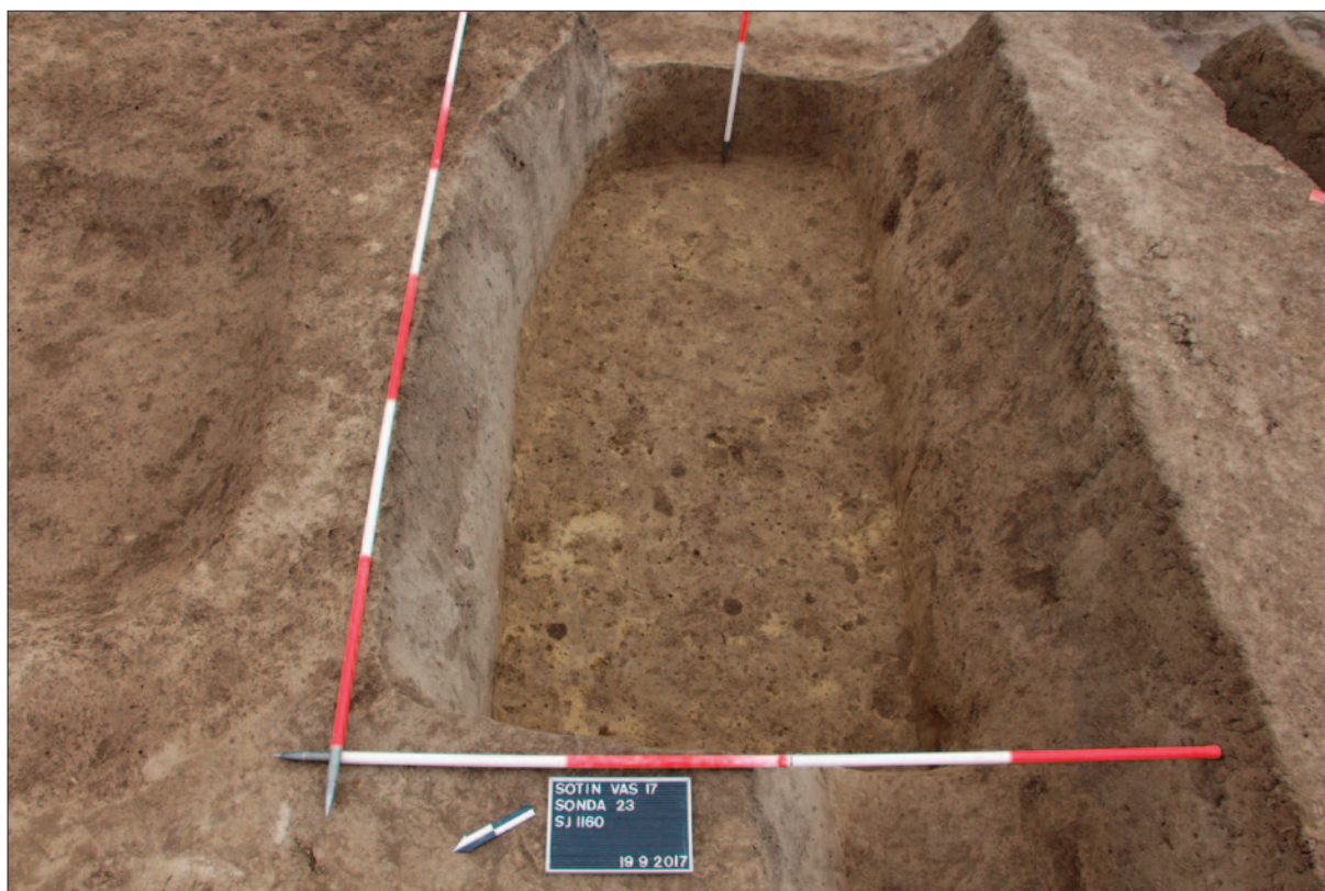
Sl. 5 Jama SJ 1160

Najmlađem vremenskom horizontu dokumentiranom tijekom istraživanja pripadaju kanali SJ 1001 i SJ 971. Orijentacija kanala kao i nalazi u njihovim zapunama datiraju ih u novije doba te povezuju s kućom koja je postojala na istoj čestici prije Domovinskoga rata. Nekoliko manjih jama sa sporadičnim nalazima ostaci su vjerojatno mjesta gdje su bile posađene voćke ili predstavljaju tragove nekih drugih aktivnosti koje su se odvijale u dvorištu kućanstva.