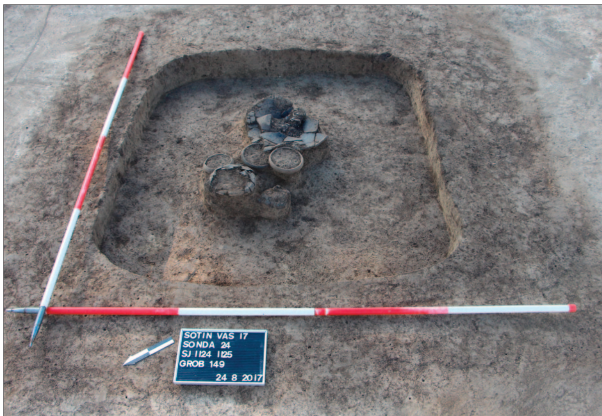
Sl. 3 Grob 149