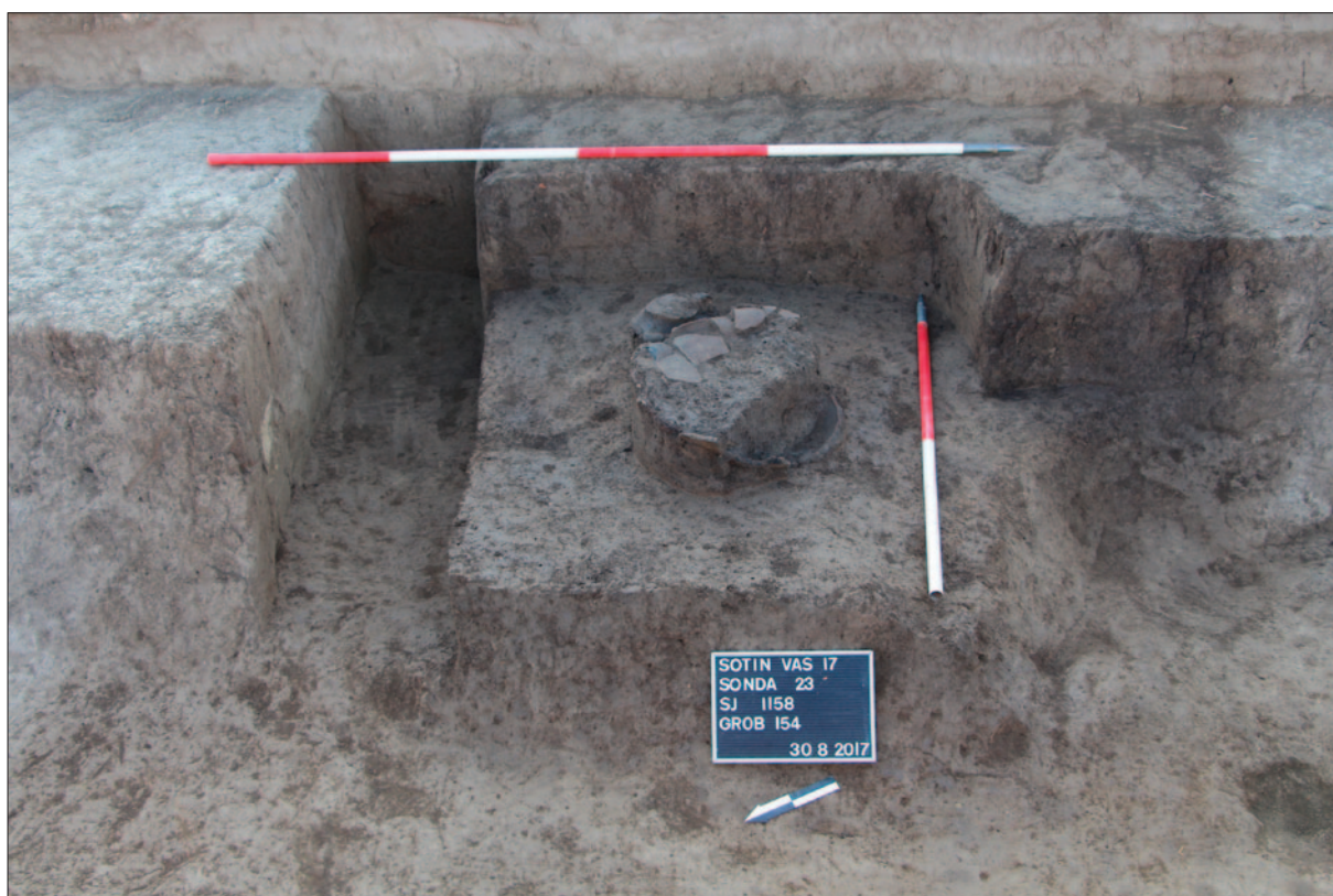
Sl. 4 Grob 154