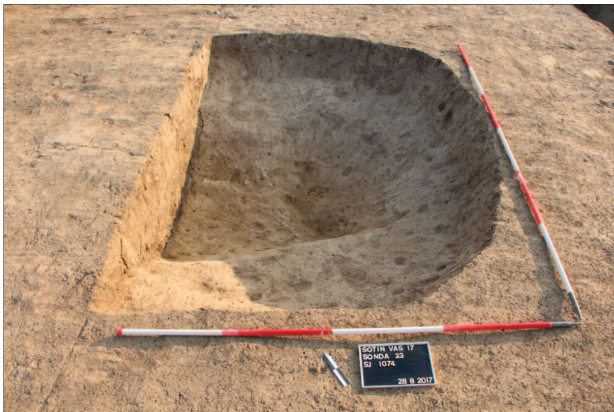
Sl. 6 Istočni dio radnoga prostora SJ 1074