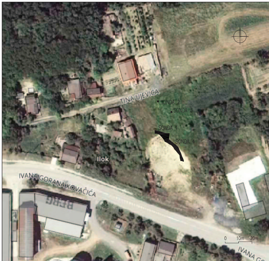
Sl. 1 Položaj istraženih sondi (crtež: K. Turkalj)