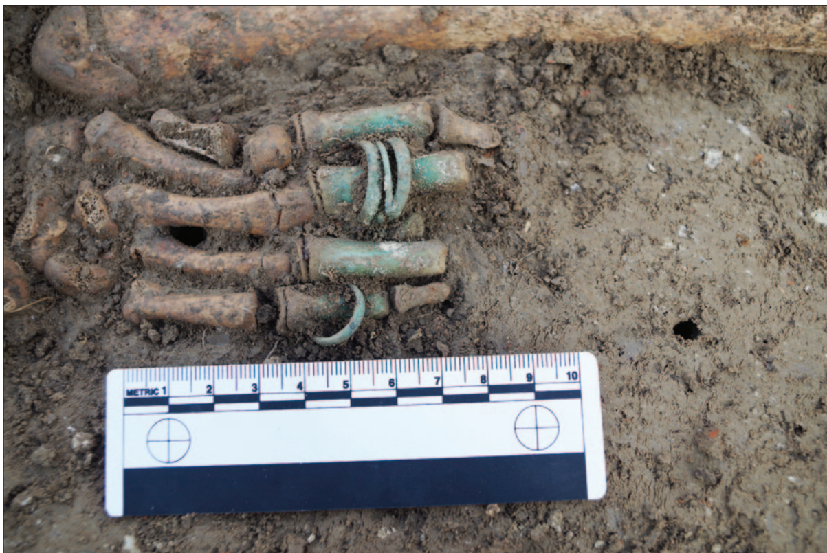
Sl. 5 Prstenje iz groba 65 in situ