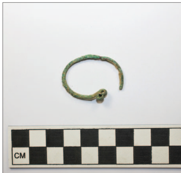
Sl. 4 S karičica iz groba 186