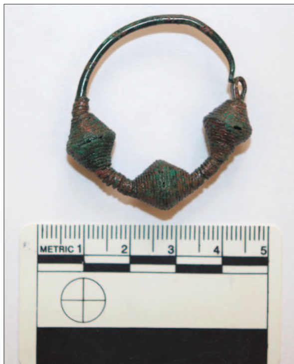
Sl. 3 Naušnica iz groba 15