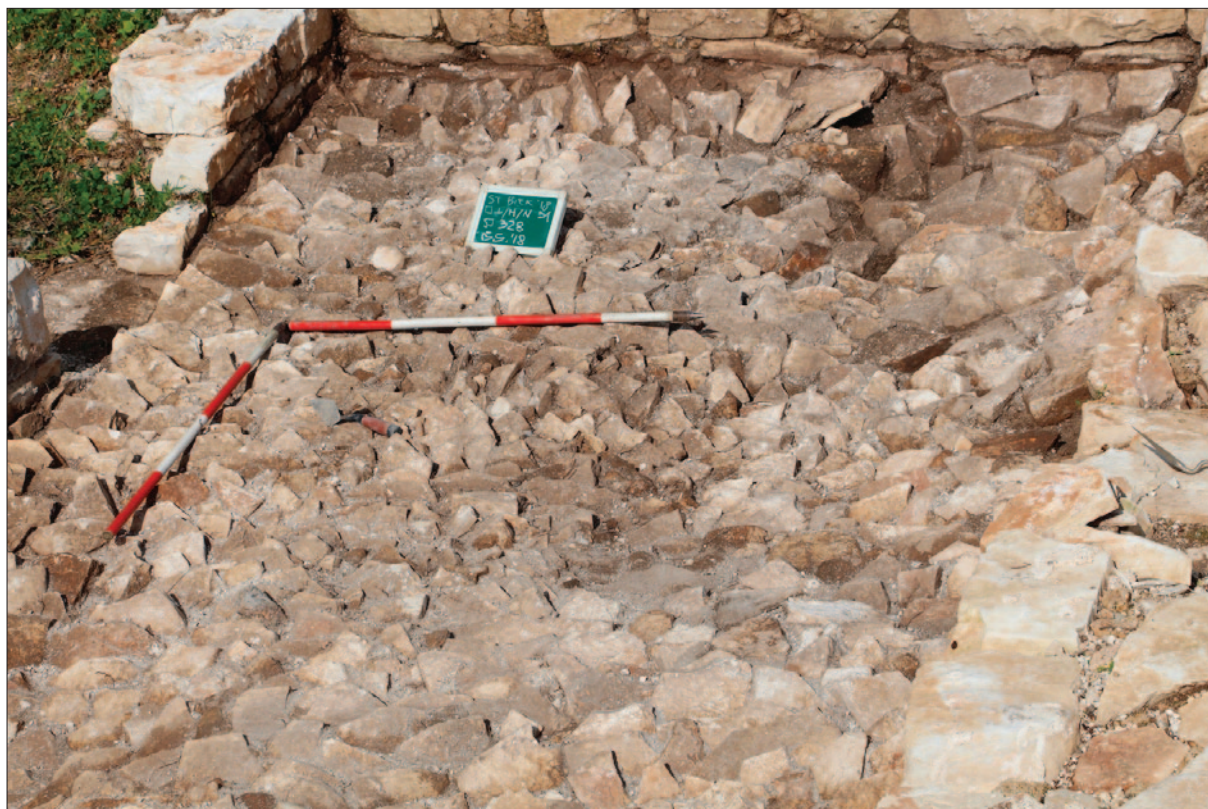
Sl. 4 P 3/8A – SJ 328, sloj pripreme podnice, detalj

Južno od G 2 utvrđena je struktura G 3: grob u kamenoj škrinji sačinjenoj od nevezanih većih kamenih ploča. Prvi se ukop odnosi na dječji ukop u reduciranoj grobnici (SJ 353) iznad veće, građene grobnice u kojoj su pokopani odrasli pokojnici (SJ 362, 382). Istražena su dva ukopa, dok je u profilu vidljiva još jedna lubanja