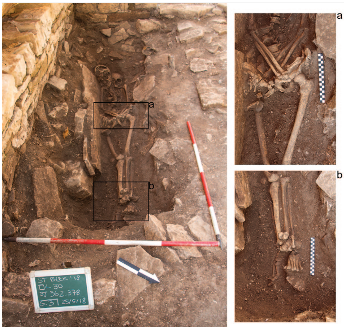
Sl. 6 Grob G 3, pokojnik SJ 362 s istaknutim detaljima prekrštenih ruku (a) i nogu (b) (snimila: B. M. Mancini; obradila: A. Konestra)