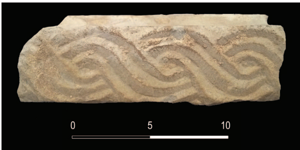
Sl. 3 Ulomak mramora s pleternim ukrasom

Na prostoru koji se proteže između jezgre srednjovjekovnoga arhitektonskog sklopa (preciznije njegova zapadnoga aneksa) i bedema već je ranijim istraživanjima utvrđen deblji sloj bagerom prebačene šute te urušenja vjerojatno još uvijek in situ . Radovima 2018. godine započeto je uklanjanje poremećenih slojeva (SJ 172, 189, 325), mahom sačinjenih od većega kamenja, rastresite žbuke i zemlje, te je u sjevernome dijelu definirana hodna površina (SJ 379) poveziva uz otvor i prag u zidu SJ 072 koji su otkriveni još 2011. godine (Šiljeg et al. 2012), dok je u južnome naznačen ukop bagerskoga iskopa koji je znatno zahvatio ovaj kao i prostor P8, po svoj prilici oštećivši i navedeni zid. Značajni nalazi s ovoga prostora odnose se na brončanu naušnicu i ulomak kamene plastike s motivom pletera (doprozornik?) uklesanoga u re-upotrebjenom mramornome profiliranom bloku (sl. 3), no oba iz poremećnoga konteksta.