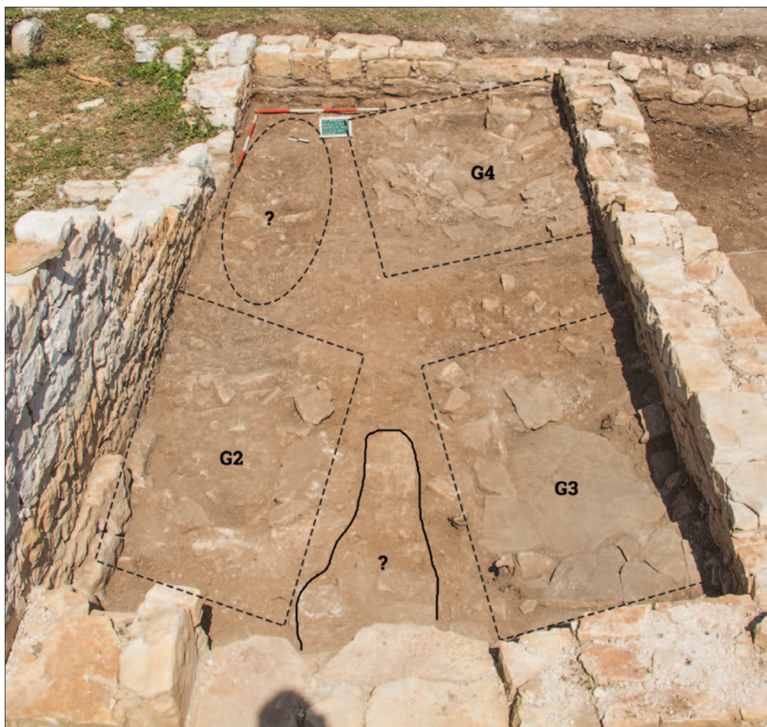
Sl. 5 Aneks 1 (P 3/8A) – smještaj potvrđenih i pretpostavljenoga groba te pretpostavljene zidne strukture (snimila: B. M. Mancini; obradila: A. Konestra)