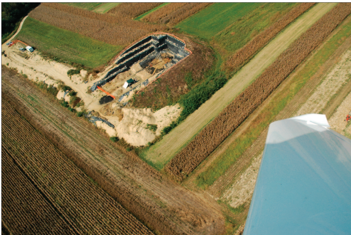
Sl. 3 Kvadratna grobna komora s krepidom i dromosom tijekom završne faze istraživanja 2018. godine

Za 2019. godinu planiran je nastavak i završetak arheoloških istraživanja same Gomile, dok, istovremeno, istraživanja cijelog arheološkog krajolika područja Jalžabeta i Martijanca, odnosno, sliva Plitvice i Bednje, tek počinju. Kao imperativ za 2019. godinu se postavlja detaljno i potpuno istraživanje konstrukcija zidova grobne komore Gomile. S druge strane, bit će potrebno istražiti i konstrukciju velikog istočnog pristupnog koridora–dromosa, koji nismo ni otvorili zbog nedostatka vremena i financijskih sredstava, a u kojemu prema analogijama s drugim lokalitetima isto treba očekivati značajne nalaze. Istraživanje samog izlaska dromosa na