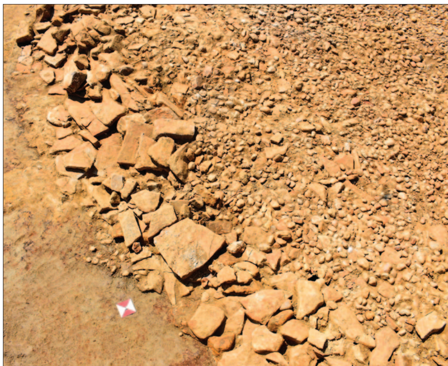
Sl. 2 Detalj vijenca krepide od lomljenog kamena

Osnovni građevinski materijal činilo je nekoliko vrsta kamena: krupni i sitniji obluci, vjerojatno doneseni