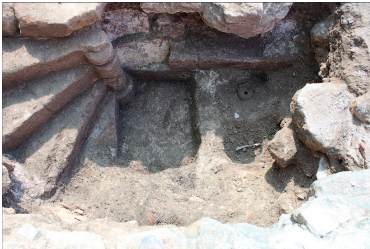
Sl. 1 Vretenasto stubište i ukop groba G-1

Zidovi su debljine oko 116 cm (sjeverni i južni), odnosno 147 cm (zapadni ili pročelni zid), a bili su ojačani potpornjacima s vanjske i lezenama s unutarnje strane. U jugozapadnome kutu iz kapele se ulazilo u vretenasto stubište (sl. 1; 5), što je izuzetna pojava na crkvama ovoga područja. Potpornjaci su se nalazili i na zapadnome zidu – utvrđeno je kako je sokl prelazio sa zapadnoga zida stubišta na jednog od njih. Što se tiče samoga stubišta, još nije jasno kamo je ono vodilo. Najvjerojatnija je pre-