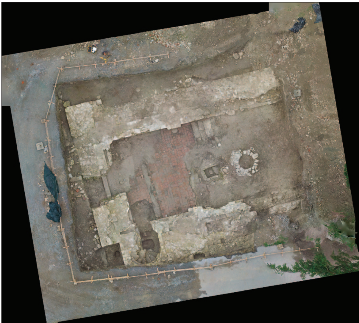
Sl. 5 Sonda I pred kraj istraživanja – orto-foto