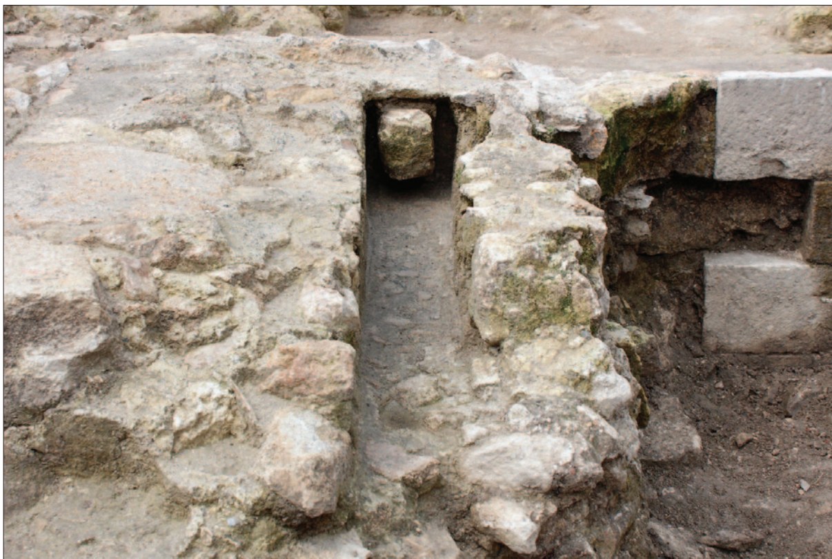
Sl. 2 Utor za zasun glavnih vrata