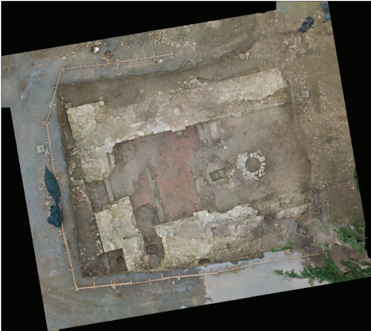
Sl. 5 Sonda I pred kraj istraživanja – orto-foto