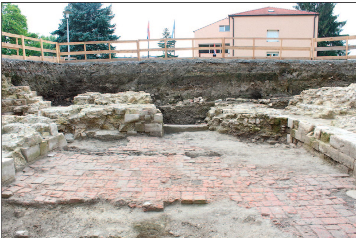
Sl. 4 Sonda I pred kraj istraživanja – pogled s istoka prema zapadu

Fig. 4 Trench I before the end of the excavation – westward view from the east