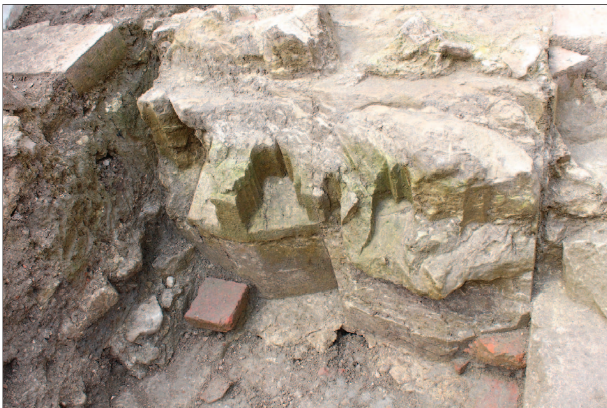
Sl. 3 Baze portala