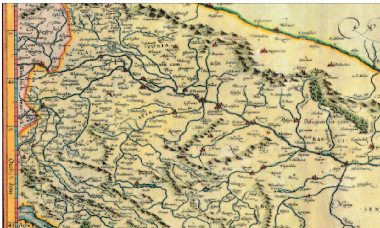
Sl. 2 Karta Scлавonia, Croatia, Bosnia cum Dalmatiae parte Gerardusa Mercatora, Amsterdam, 1623. (Kozličić 2018: 89, 90, K-13); isječak

Ostaje pitanje može li postojeći toponim Bjelavina – koji doista može biti prežetak 1334. godine zapisanog toponima Belina – pomoći u ubikaciji? Problem je što je to čest toponim pa ga tako na habsburškim kartama nalazimo, primjerice, i uz Kraljevu Veliku ( Bielavina ) (treća vojna izmjera 1869. – 1877.) ili u brdima iznad Voćarice i