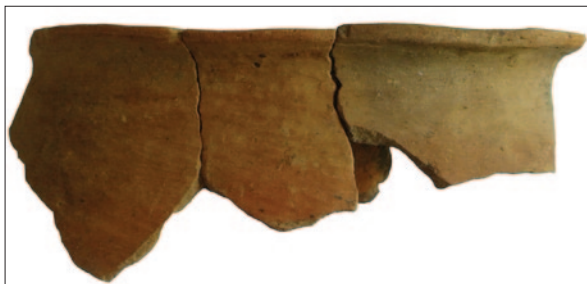
Sl. 2 Ulomak lonca iz 1. popločenja ognjišta SJ 390