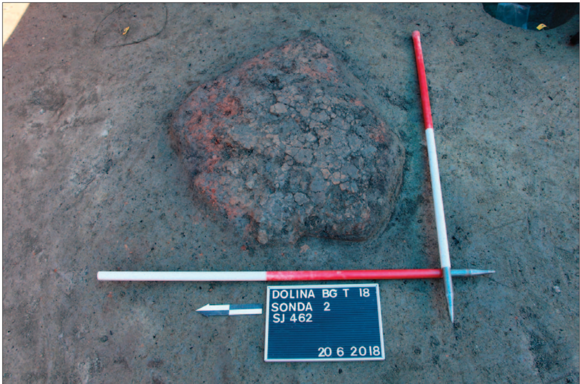
Sl. 5 Dolina Babine Grede – Tukovi, ognjište SJ 462