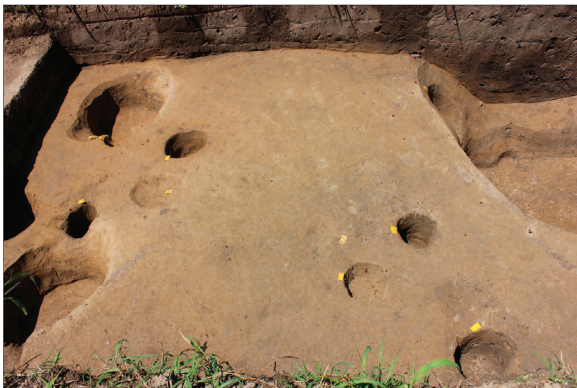
Sl. 9 Dolina Babine Grede – Tukovi, istraženi horizont 5 u središnjem dijelu sonde 2