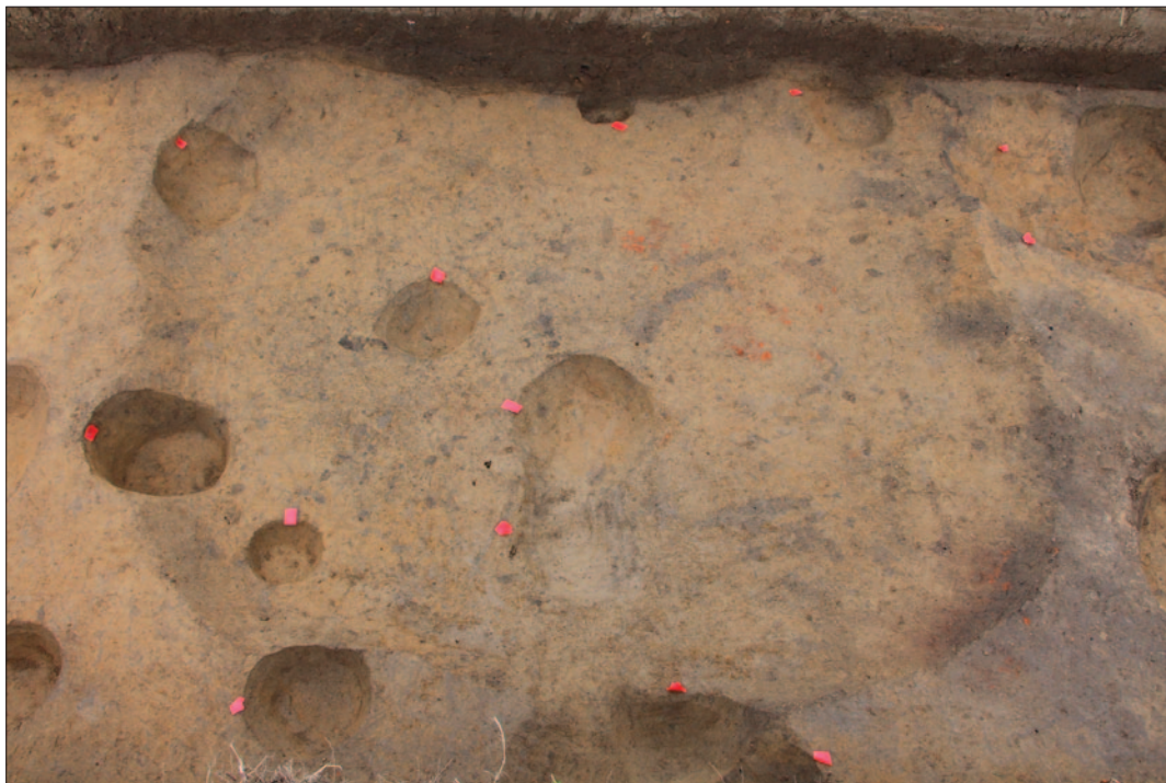
Sl. 3 Dolina Babine grede – Tukovi, ukop jame SJ 402 s nizom ukopa za stupove

Nakon ručnoga iskopa sloja SJ 386, u južnome dijelu sonde otkriven je sloj SJ 387 u koji je bila ukopana četvrtasta jama SJ 402 na čijem su južnom dijelu otkriveni ukopi za stupove njezine konstrukcije (sl. 3). Južno od jame uočeni su nizovi ukopa za stupove koji su položeni na povišenome dijelu grede. Stupovi su se pružali u smjeru istok – zapad (sl. 4). Na najvišem dijelu grede također su uočeni ukopi rupa za stupove koji se pružaju u smjeru sjever – jug. Sjeverno od sloja SJ 387 zamijećen je i sivo-smeđi masni sloj zemlje SJ 452 koji je sadržavao manje nalaza keramike i kućnoga lijepa.