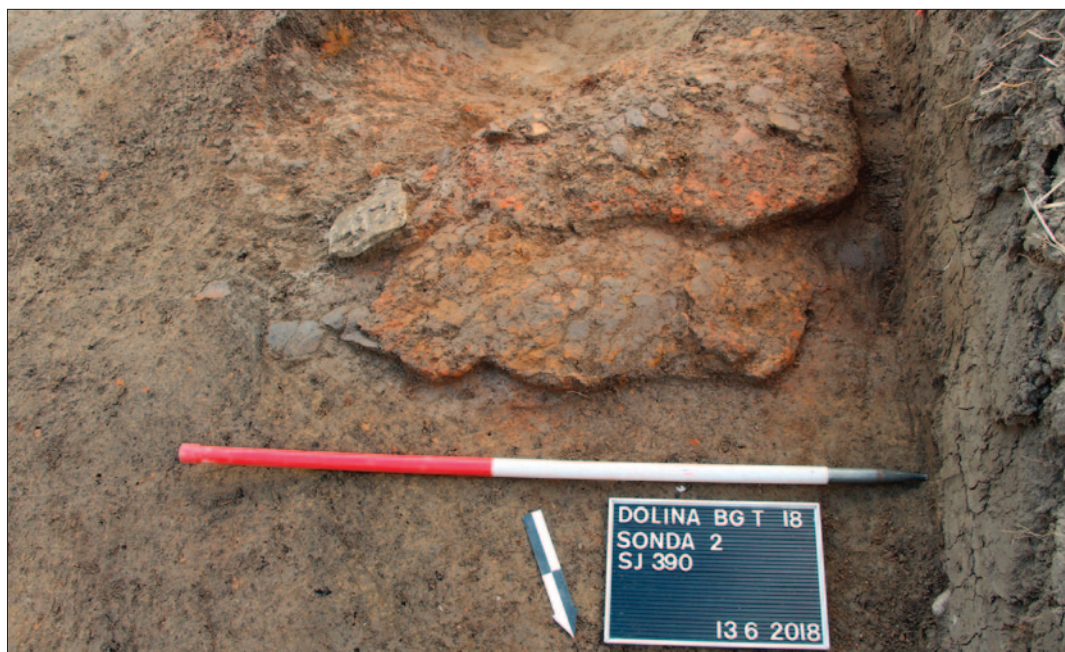
Sl. 1 Dolina Babine grede – Tukovi, ognjište SJ 390

Ispod sloja SJ 389 izdvojen je tamnosmeđi sloj zemlje SJ 386 s velikom količinom keramike, kućnoga lijepa i kamena na čijem vrhu je bila brončana jednopetljasta fibula s tordiranim lukom te ognjište SJ 390 sa supstrukcijom od keramičkih ulomaka. Ognjište je imalo dvije obnove (sl. 1–2).