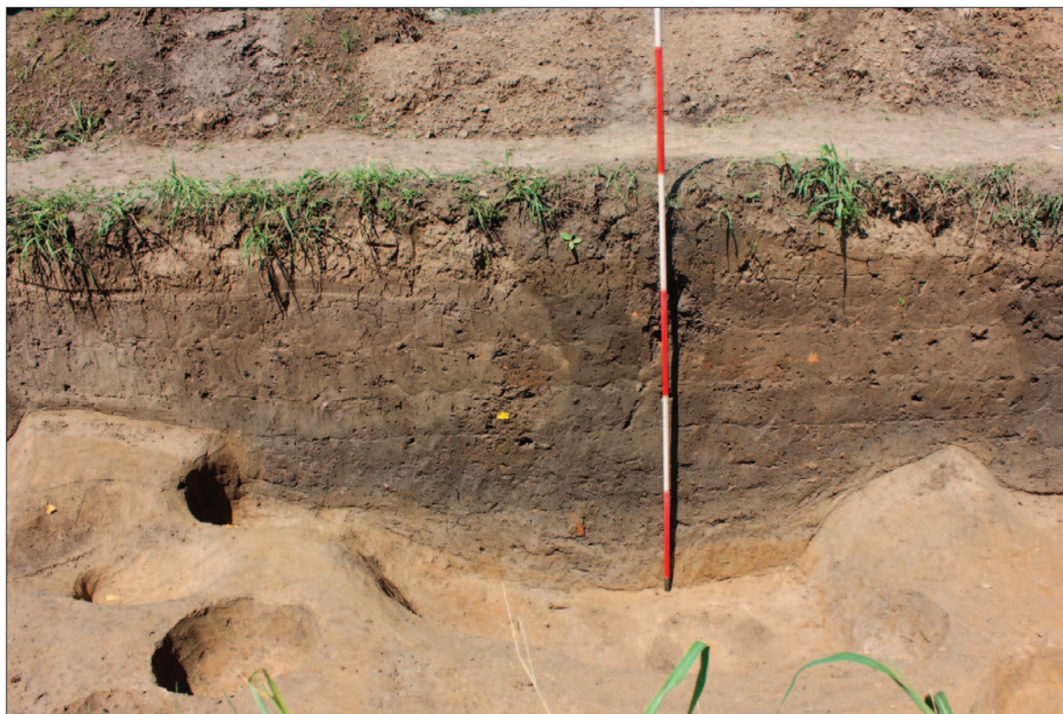
Sl. 8 Dolina Babine Grede – Tukovi, presjek zapuna najdublje dijela objekta SJ 530