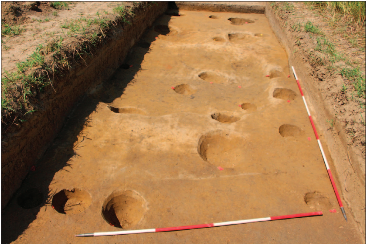
Sl. 4 Dolina Babine grede – Tukovi, sonda 2, horizont 2 (snimila: D. Ložnjak Dizdar)