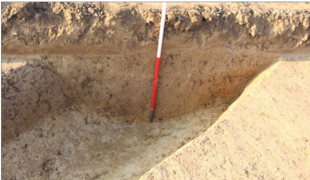
Sl. 4 Presjek zapune kanala SJ 9 na zapadnome dijelu nalazišta