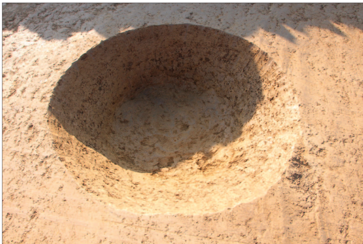
Sl. 5 Ukop jame SJ 13 na zapadnome dijelu nalazišta