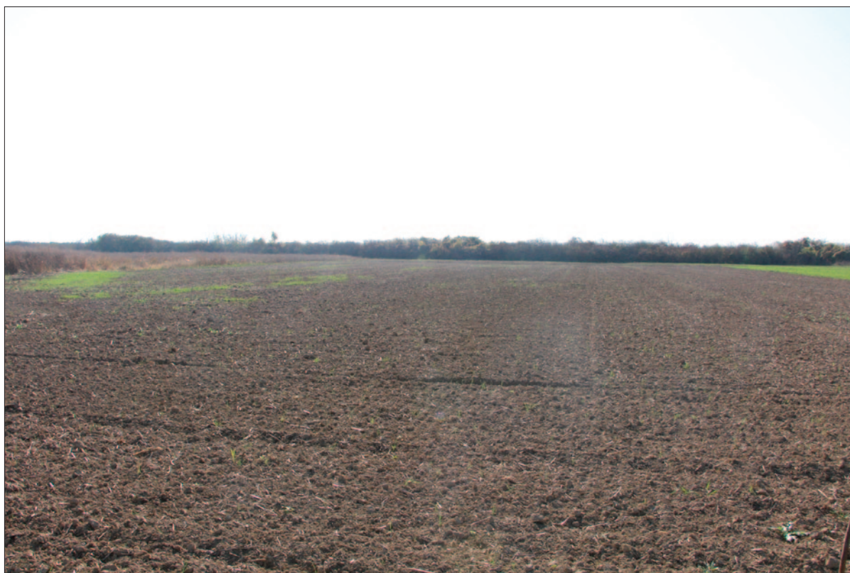
Sl. 1 Pogled na nalazište sa sjevera

Map 1 Position of the AN 3 Petrijevci – Španice site (prepared by: M. Dizdar)