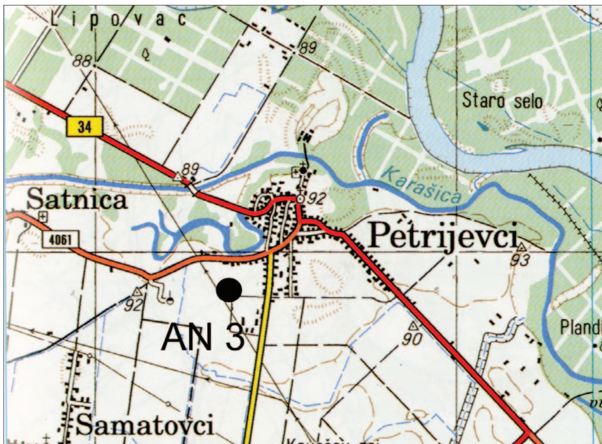
Karta 1 Položaj nalazišta AN 3 Petrijevci – Španice (izradio: M. Dizdar)

Map 1 Position of the AN 3 Petrijevci – Španice site (prepared by: M. Dizdar)