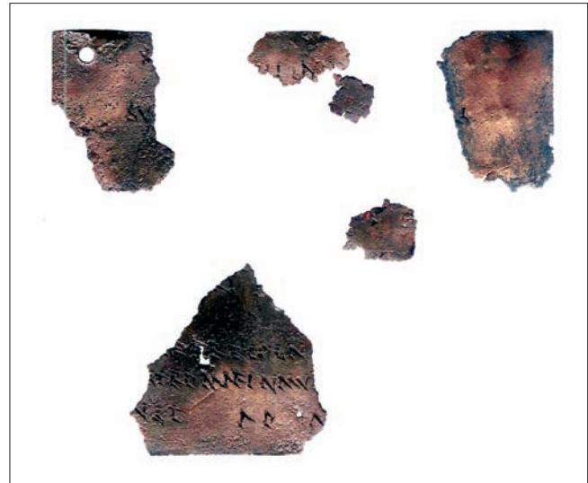
Sl. 2 Druga pločica, iznutra Abb. 2 Zweites Täfelchen, Innenseite