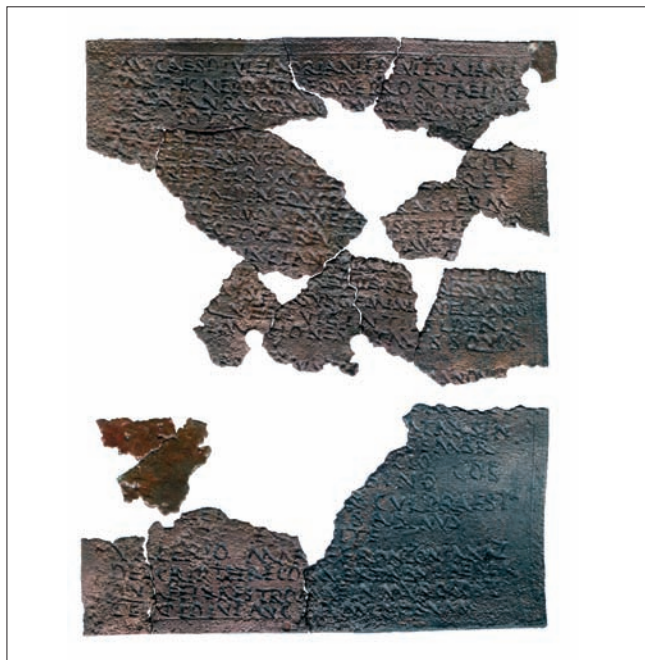
Sl. 3 Prva pločica, izvana Abb. 3 Erstes Täfelchen, Außenseite

DI[...] HONEST MI[...]QVOR NOM SVB SC[...]NT CI[...]T ROM QVI EORVM NON 15 HAB[...] DEDIT ET CON CV[...] VX QVAS TVNC HAB CVM [...]IVIT IS DA[...] AVT CVM IS QVAS P[...] DVX[...] DVMT[...]INGVLIS