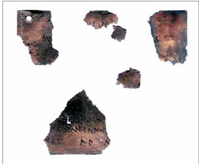
Sl. 2 Druga pločica, iznutra Abb. 2 Zweites Täfelchen, Innenseite