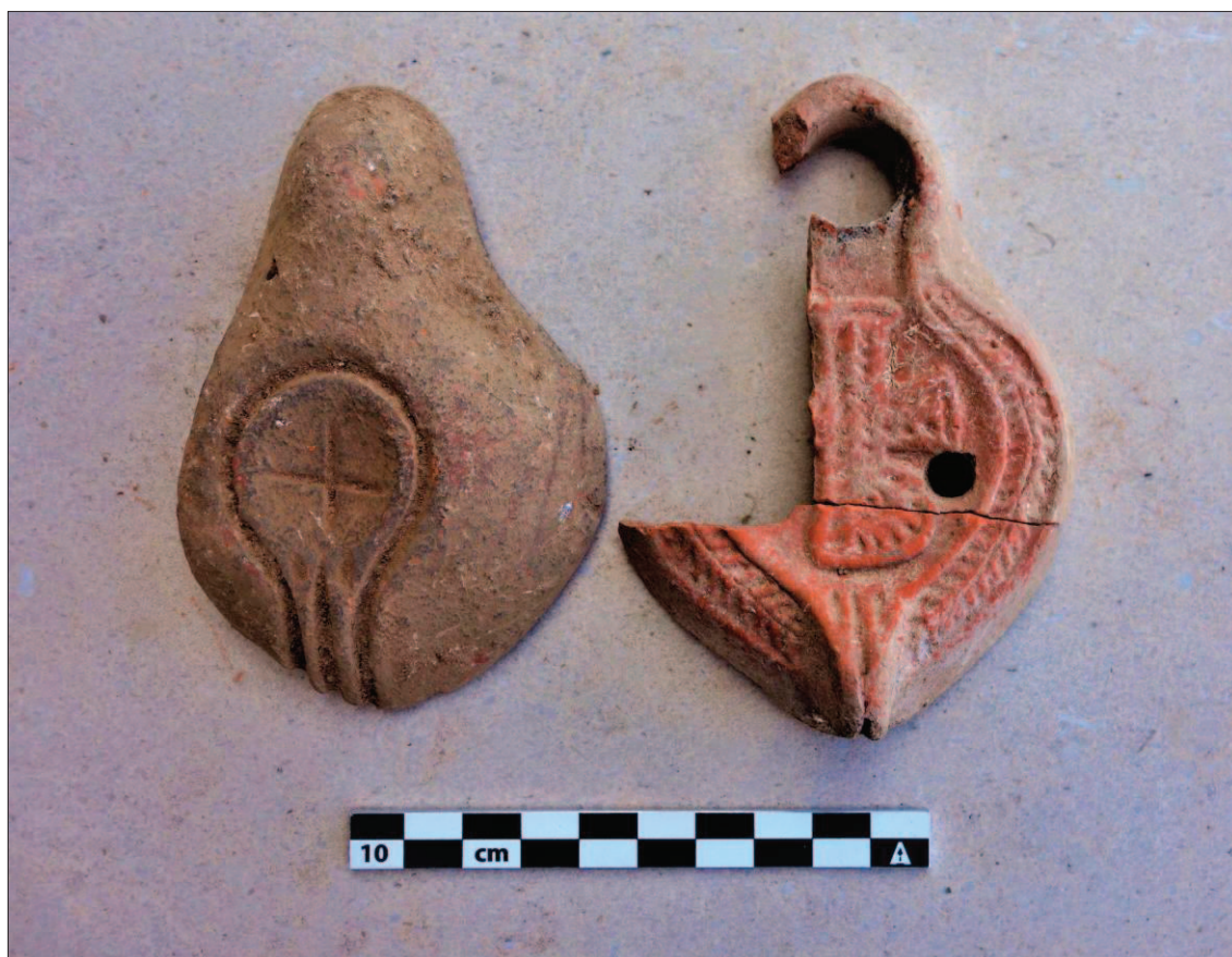
Sl. 2 Lucerna s kristogramom