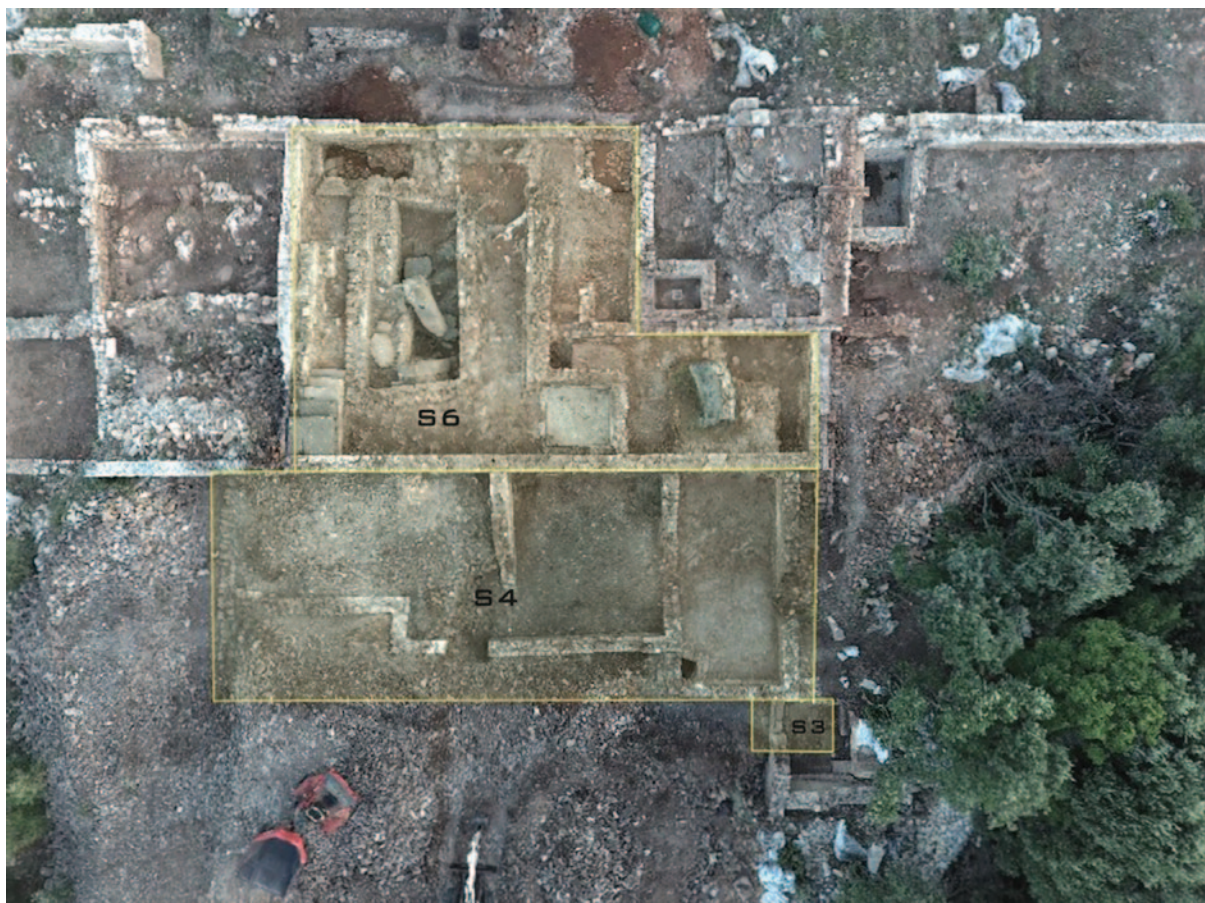
Sl. 1 Istraženi dijelovi sektora, Novo Selo Bunje, 2019. godine