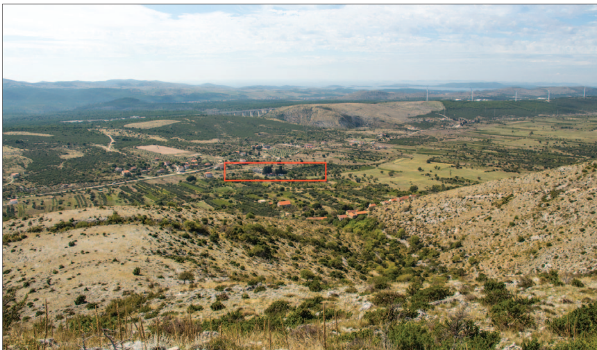
Sl. 1 Pogled na Danilsko polje s padina Gradine; crvenim je obilježena zona na kojoj su provedena istraživanja 2019. godine