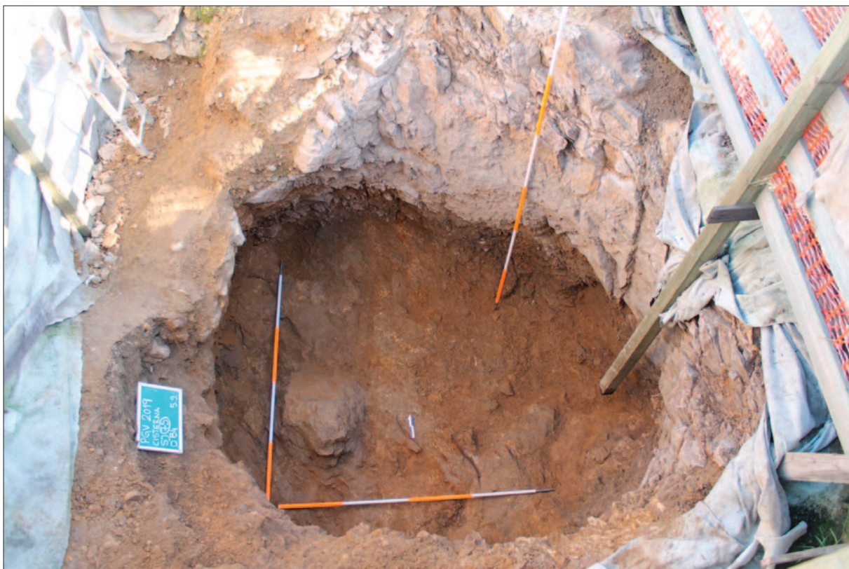
Sl. 2 Ukop cisterne, pogled s juga