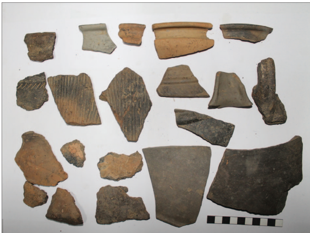
Sl. 3 Izbor ulomaka kasnolatenskih posuda iz SJ 34