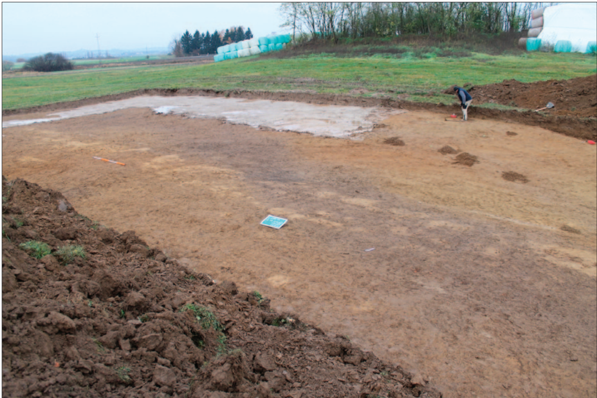
Sl. 1 Pogled na mrlje arheoloških tvorevina s juga; gore na slici brežuljak s pretpostavljenim položajem srednjovekovne utvrde