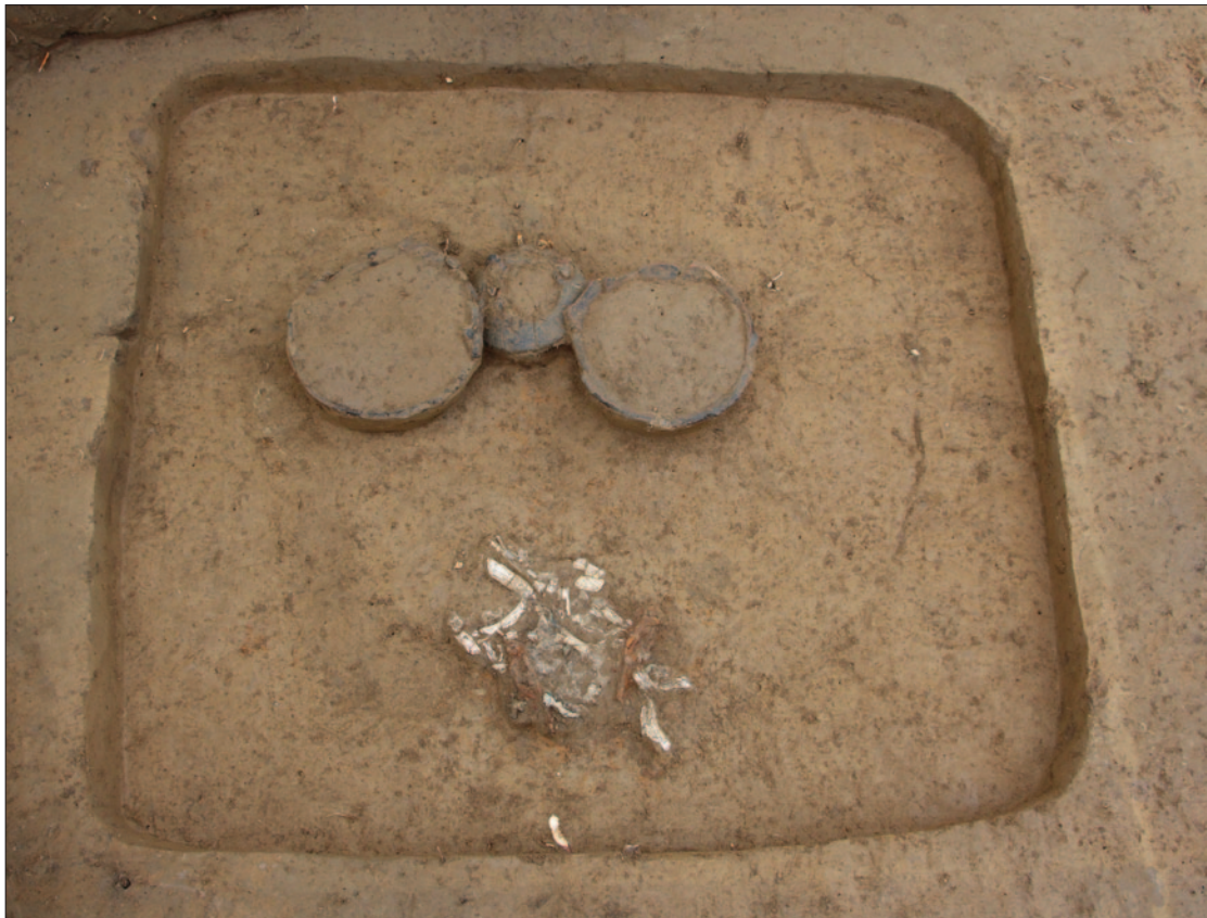
Sl. 4 Grob LT 129 Fig. 4 Grave LT 129