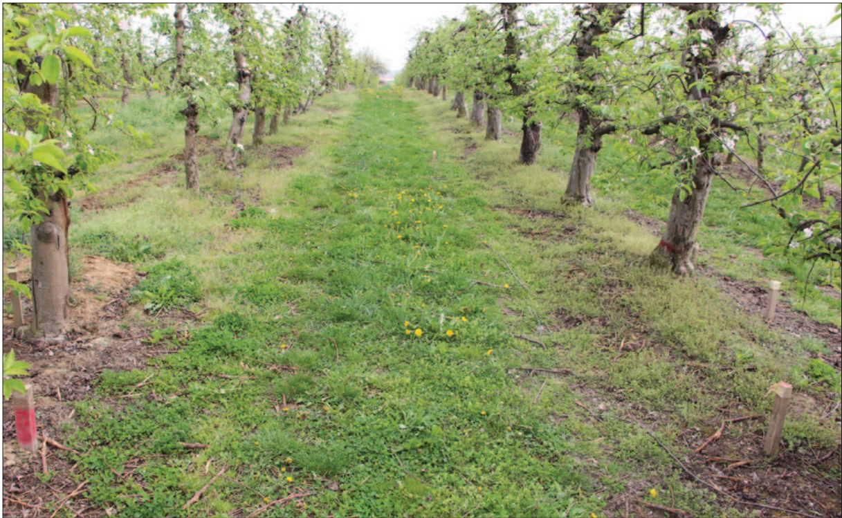
Sl. 1 Pogled na sondi 20 prije početka istraživanja koja je položena na zapadnoj padini uzvišenja Fig. 1 A view at trench 20 before the beginning of the excavation that was laid on the western slope of the elevation

no te zapadno od sondi u kojima su tijekom istraživanja 2001. – 2002. te 2016. – 2018. godine pronađeni brojni paljevinski grobovi latenske kulture (Tomičić et al. 2002; Dizdar 2017; 2018; 2019). Na tome su dijelu groblja tijekom spomenutih iskopavanja pronađeni grobovi bogato opremljenih ratnika s naoružanjem, toaletnim priborom i nošnjom te grobovi žena s predmetima nošnje i nakita. U grobovima oba spola nalazila se i popudbina kojoj pripadaju nalazi keramičkih posuda i životinjskih kostiju.