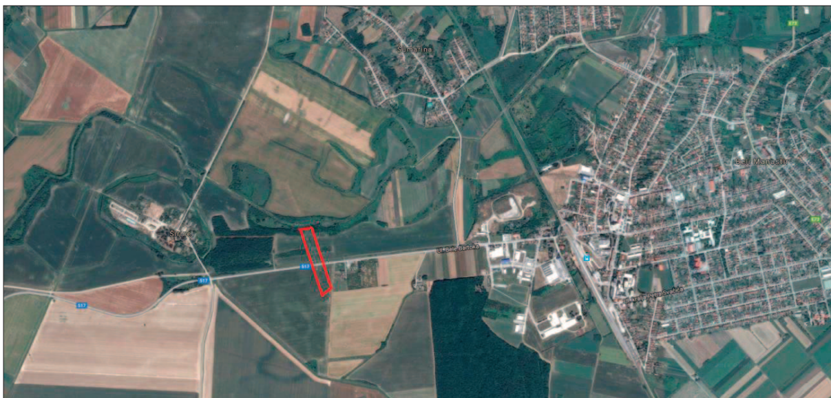
Sl. 1 Položaj lokaliteta AN 2 Beli Manastir – Popova zemlja (izvor: Google maps; priredila: Dž. Los)