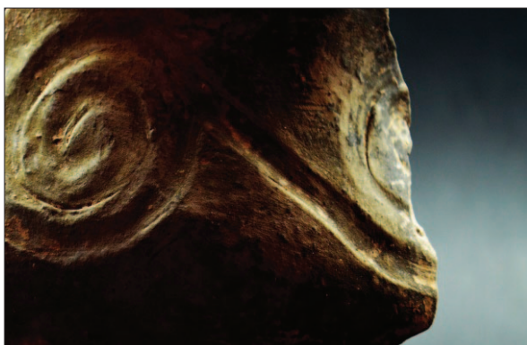
Sl. 16 Ulomak ukrašene neolitičke posude

Rezultati istraživanja lokaliteta AN 2 Beli Manastir – Popova zemlja govore da je riječ o iznimno bogatome višeslojnom nalazištu. Mlađa faza se pripisuje antičkome periodu, a kao najznačajnije arheološke tvorevine ističu se dvije peći za proizvodnju opeke. Keramički materijal iz jama raznih namjena kao i iz pronađenog groba datiraju mlađi horizont lokaliteta u 3. stoljeće. Stariju fazu određuju brojne arheološke tvorevine koje pripadaju prapovijesnome periodu, a koje definiraju karakter lokaliteta kao nasebinski. Naime, posebnost lokaliteta je prostorna veličina prapovijesnoga naselja od gotovo 15.000 m 2 ko-