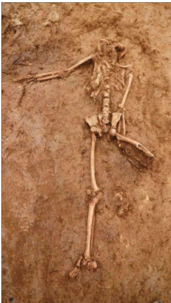
Sl. 9 Grob 15 Fig. 9 Grave 15