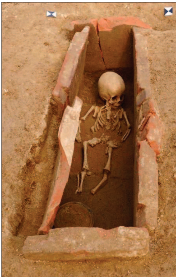
Sl. 2 Antički dječji grob s tegulama

Fig. 2 Roman child's grave with tegulae