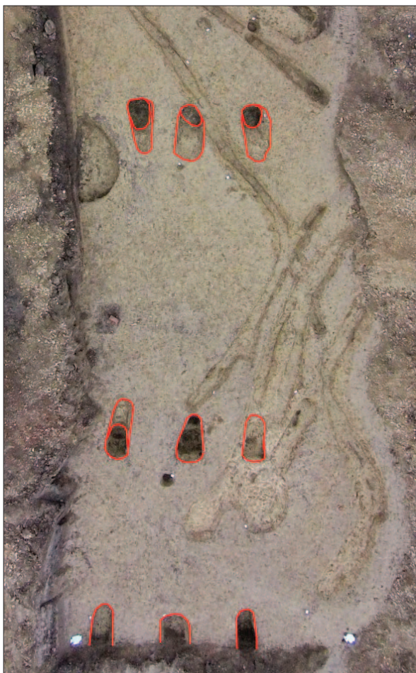
Sl. 7 Orto-foto pogled na neolitički nadzemni objekt 29