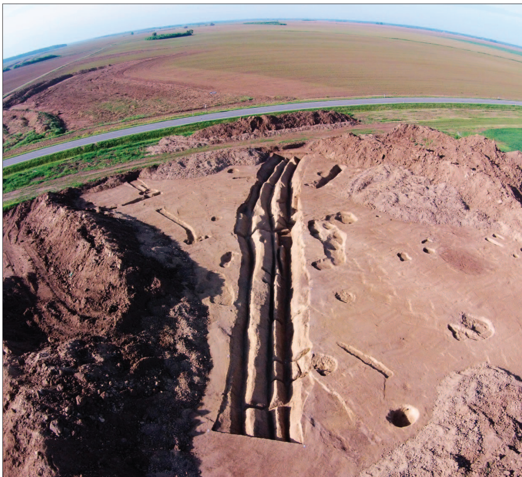
Sl. 11 Ukop neolitičkoga kanala, pogled iz zraka prema jugu

Fig. 11 Buried Neolithic ditch, aerial view to the south