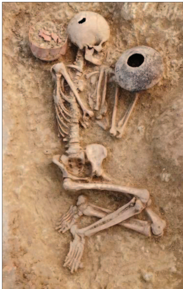
Sl. 8 Grob 3

Grob 15 je djelomično očuvani kostur odrasle muške osobe starosti oko 50 godina. Otkriven je na vrhu zapune ukopa objekta 22, uz njegov istočni rub (sl. 9). Orijentiran je sjeveroistok – jugozapad, s glavom okrenutom prema istoku. Položen je na leđa s glavom zabačenom unazad. Desna ruka je odmaknuta od torza te je ispružena u visini ramena, dok je lijeva ispružena uz torzo. Desna noga je ispružena, dok je bedrena kost lijeve noge odmaknuta u stranu. Pokojnik je položen bez priloga koji bi ga mogli datirati, ali ga je radiokarbonski datum datirao kao najstariji ukop na lokalitetu, odnosno kao starčevački (6850±40 BP, 5837–5659 calBCE (95%), Poz-90129) (Šošić Klindžić, Hršak 2014: 27).