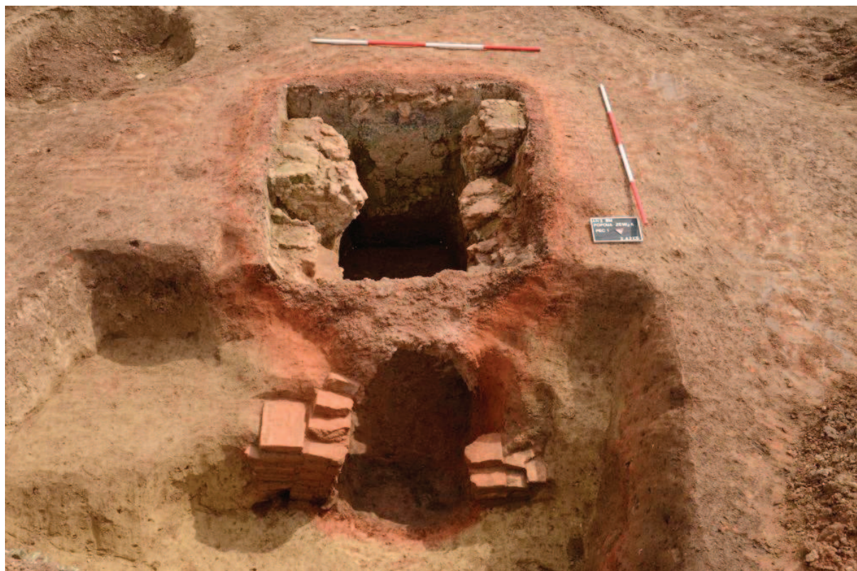
Sl. 3 Antička peć 1

Peć 7 otkrivena je na sredini sjevernoga dijela lokaliteta te tlocrtno zauzima površinu od 30-tak m 2 (sl. 4). Otkriveni su ostaci perimetralnih zidova s unutarnjim pregradnim zidom ukopanim u sloj zdravice kao i prostor