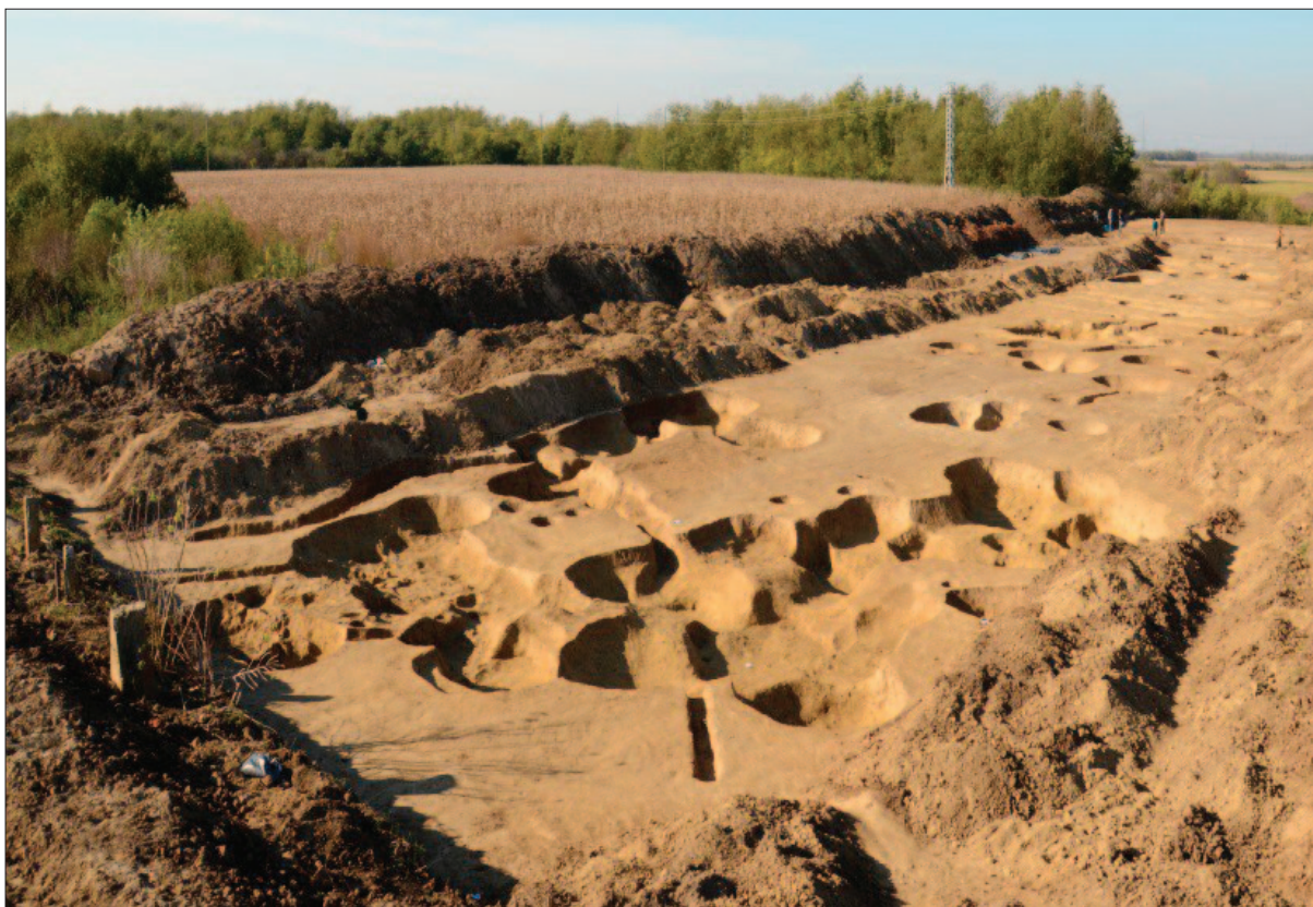
Sl. 6 Kompleks ukopa neolitičkih objekata (objekti 2, 3, 10 i 11)