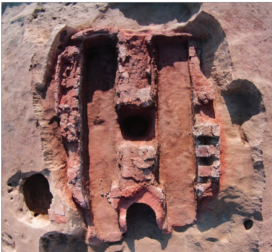
Sl. 4 Orto-foto prikaz peći 7, pogled iz zraka Fig. 4 Orto-photo view of kiln 7, aerial view

pripadajuće otpadne jame pred ulazom. Peć je longitudinalnoga oblika, orijentirana zapad – istok kao i spomenuta manja peć 1. Tipološki se svrstava u tip dvodijelne vertikalne peći pravokutnoga vatrišta s dvostrukim hodnikom i centralnim prezidom (Šimić-Kanaet 1996: 164).