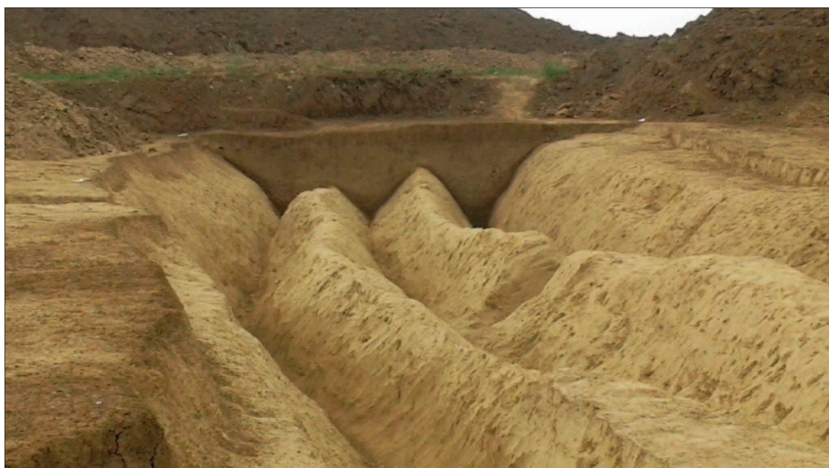
Sl. 12 Trostruki „V” presjek neolitičkoga kanala

Fig. 11 Buried Neolithic ditch, aerial view to the south