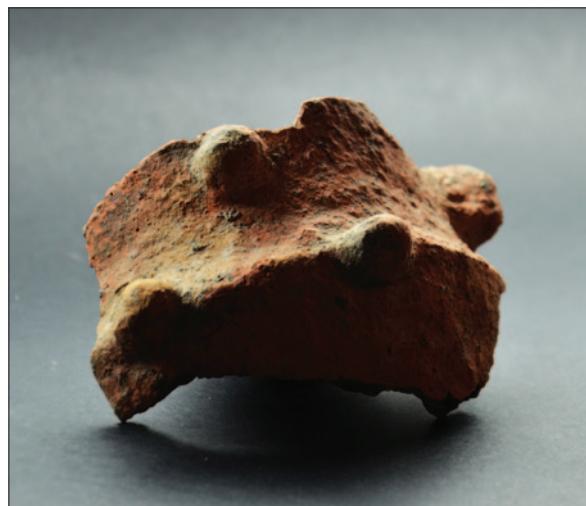
Sl. 17 Ulomak ukrašene neolitičke posude

Fig. 15 Fragment of a painted vessel of the Starčevo culture