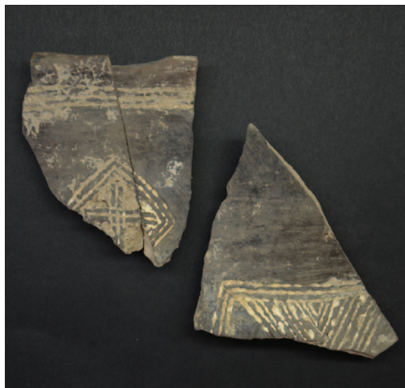
Sl. 19 Ulomci ukrašene keramike eneolitičke posude

S obzirom na veličinu prostora na kojem se rasprostire lokalitet kao i koncentraciju arheoloških tvorevina i bogatstvo nalaza, za lokalitet AN 2 Beli Manastir – Popova Zemlja može se tvrditi da pripada arheološkim nalazištima koji svojim postojanjem neupitno obogaćuju hrvatsku arheološku baštinu. Postavlja se pitanje da li je lokalitet u jednome periodu neolitika egzistirao kao naselje, a u drugome kao groblje. Daljnje bavljenje problematikom lokaliteta koji zahtjeva podroban i ozbiljan znanstveni pristup mogao bi potvrditi ili opovrgnuti takvo promišljanje.