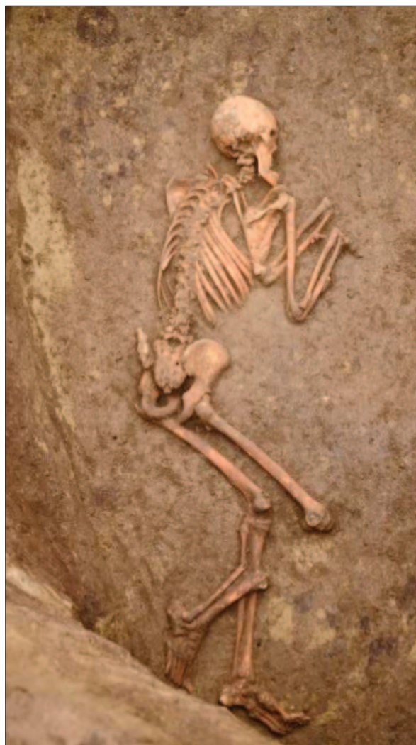
Sl. 10 Grob 17 Fig. 10 Grave 17

Grob 17 predstavlja dobro očuvani kostur muškarca starosti između 26 i 32 godine, orijentacije jug – sjever, s glavom okrenutom prema jugu (sl. 10). Položen je na trbuh, s glavom okrenutom na lijevi obraz te nogama lagano svinutim u koljenima na desnu stranu i rukama savinutim uz torzo sa šakama prema glavi. Položen je na dno ukopa jame koja je na osnovi utvrđenih svojstava zapuna definirana kao otpadna jama. Datiran je kao najmlađi grob otkriven na lokalitetu koji pripada badenskome kulturnom krugu ( 4176 \pm 28 BP, 2884–2666 calBCE (95%), BRAMS-1304) (Balen 2018: 68, 75).