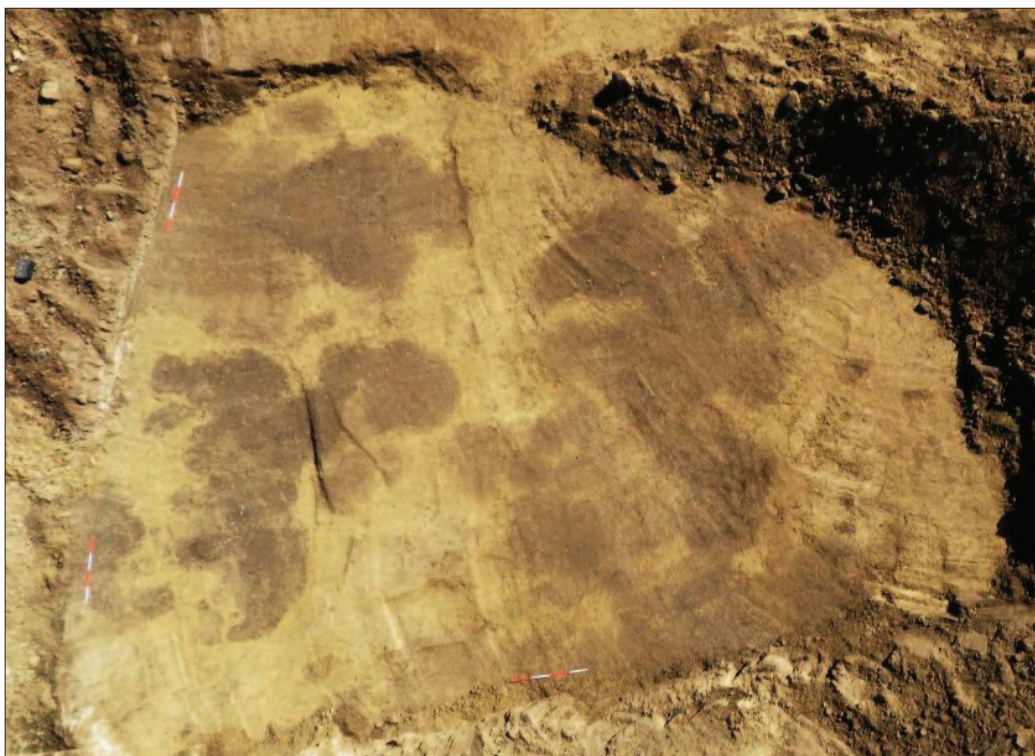
Sl. 5 Obris zapuna neolitičkih objekata (objekti 23 i 27), pogled iz zraka