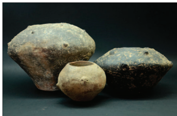
Sl. 18 Neolitičke posude iz grobova

Fig. 16 Fragment of a decorated Neolithic vessel