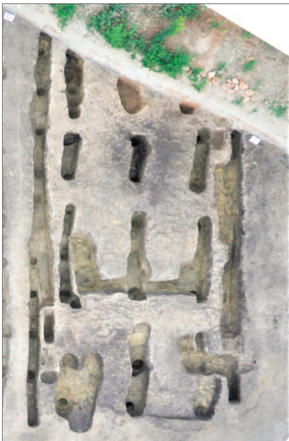
Sl. 8 Tlocrtna koncepcija ukopa starije faze objekta 6