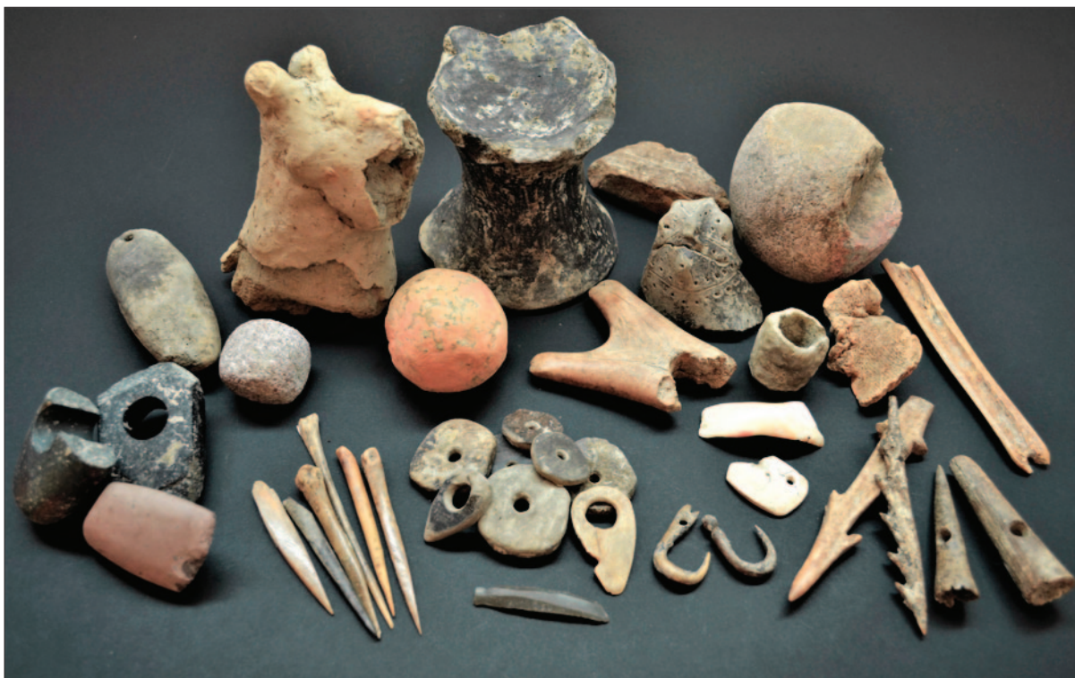
Sl. 11 Pokretni nalazi s lokaliteta AN 6 Hermanov vinograd 1

Fig. 11 Mobile finds from the site of AN 6 Hermanov Vinograd 1