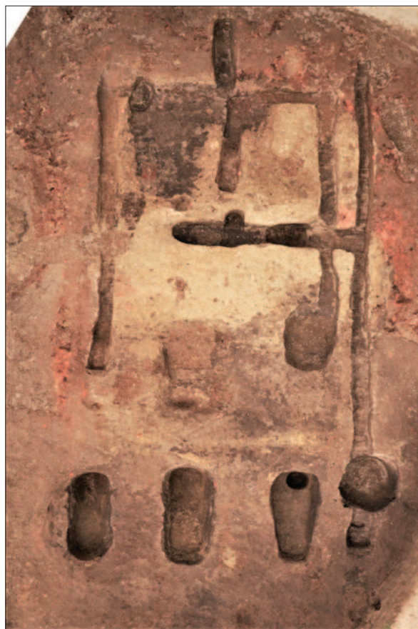
Sl. 10 Tlocrtna koncepcija ukopa mlađe faze objekta 7

Objekt 9, za kojega se smatra da pripada stambenoj arhitekturi, također dominira prostorom zapadnoga dijela lokaliteta. Paralelno se rasprostire tik uz objekt 6, s njegove zapadne strane. Zauzima oko 100 m 2 površine, orijentacije je sjever – jug. Tlocrtna shema ukopa objekta pokazuje sličnost i ujednačenost s tlocrtnom shemom starijih faza objekata 6 i 7. Naime, temeljni ukopi pojavljuju se u tri niza s po tri ukopa, a odlikuje ih masivnost. Specifičnost objekta 9 je u tome što je središnji prostor s istočne i zapadne strane omeđen temeljnim kanalima koji se protežu cijelom dužinom objekta kao temelji perimetralnih stijena na koje su okomito postavljeni nizovi manjih,