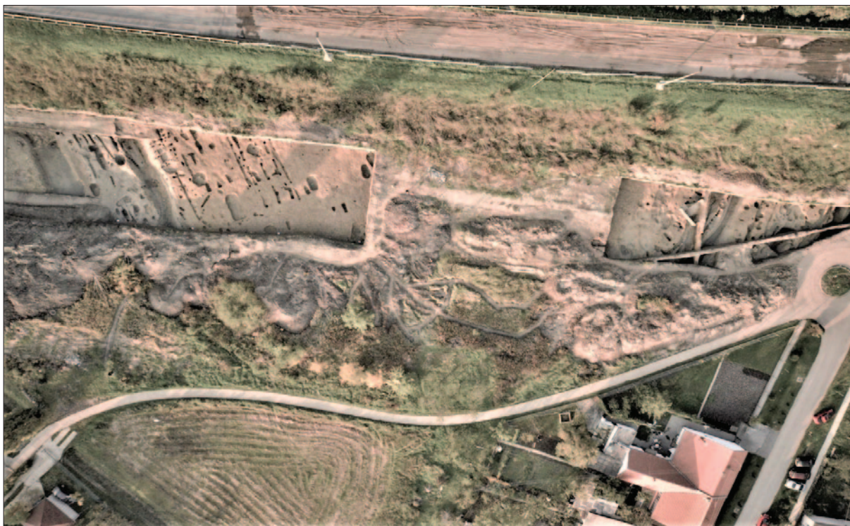
Sl. 15 Završna situacija lokaliteta AN 6 Hermanov vinograd 1, pogled iz zraka