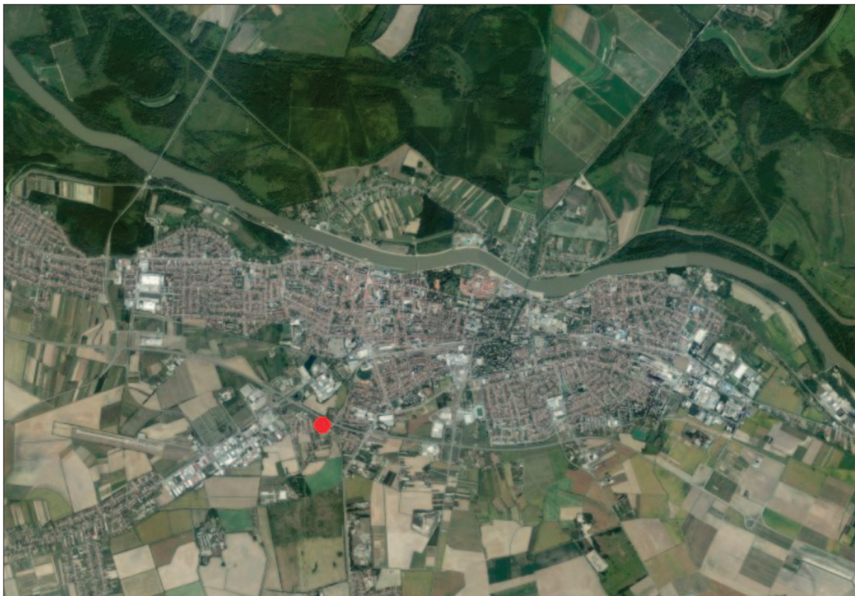
Sl. 1 Pozicija lokaliteta Hermanov vinograd u južnome dijelu grada Osijeka (izradila: Dž. Los)