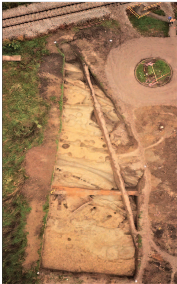
Sl. 4 Pogled na opkop s ostacima palisade 1. najstarije građevne faze istočnoga dijela lokaliteta

Drugoj stratigrafskoj fazi, odnosno građevnom horizontu 3, pripada objekt 5 koji je prepoznat kao sloj zapečene zemlje tvrde konzistencije i izrazito crvene boje. Nepravilnog je tlocrtnoga oblika, otkrivene površine 38 m 2 , budući da se proteže ispod zapadnoga profila istočnoga dijela istraživanoga prostora. Utvrđena veličina objekta je arbitrarno definirana, ali ipak pruža relevantne podatke. Prema različitim slojevima podnica, utvrđene su tri faze korištenja objekta. Podnice su bile razvedene manjim ukopima jama za stupove koji su vjerojatno podržavali konstrukciju natkrivanja prostora te kanalčićima za koje