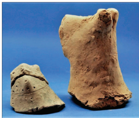
Sl. 12 Figuralna plastika

Ulomci keramičkih posuda najbrojniji su nalaz te su sakupljene 103 kutije, odnosno okvirno 1.700 kg (60.100 ulomaka). Po svojim značajkama pronađeni keramički materijal identičan je keramičkome materijalu pronađenom u prijašnjim istraživanjima (Šimić 2000: 225). Uočene su dvije najčešće fature prapovijesne keramike, gruba i srednje do fina. Gruba keramika hrapave je neravne površine, nepročišćena s velikim udjelom primjesa gruboga pijeska. Debljina stjenki je neujednačena