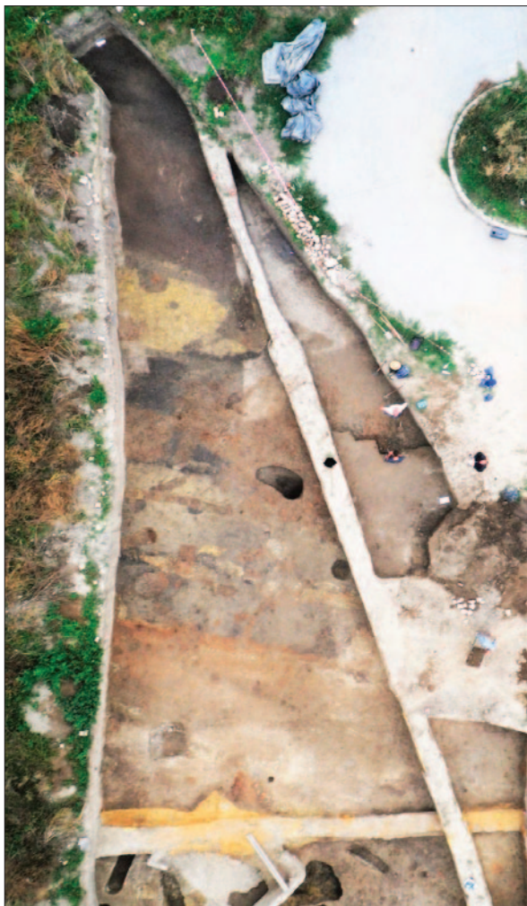
Sl. 3 Pogled iz zraka na 2. građevnu fazu naselja istočnoga dijela lokaliteta

Fig. 3 Aerial view of the second construction phase of the settlement in the eastern part of the site