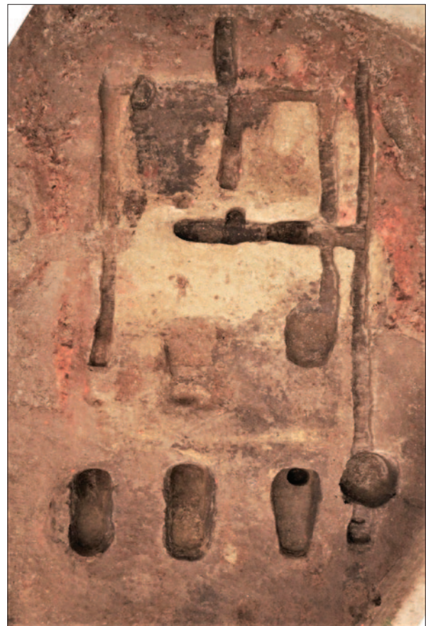
Sl. 10 Tlocrtna koncepcija ukopa mlađe faze objekta 7

Objekt 9, za kojega se smatra da pripada stambenoj arhitekturi, također dominira prostorom zapadnoga dijela lokaliteta. Paralelno se rasprostire tik uz objekt 6, s njegove zapadne strane. Zauzima oko 100 m 2 površine, orijentacije je sjever – jug. Tlocrtna shema ukopa objekta pokazuje sličnost i ujednačenost s tlocrtnom shemom starijih faza objekata 6 i 7. Naime, temeljni ukopi pojavljuju se u tri niza s po tri ukopa, a odlikuje ih masivnost. Specifičnost objekta 9 je u tome što je središnji prostor s istočne i zapadne strane omeđen temeljnim kanalima koji se protežu cijelom dužinom objekta kao temelji perimetralnih stijena na koje su okomito postavljeni nizovi manjih,