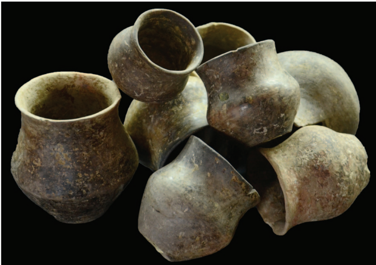
Sl. 14 Set lončića Fig. 14 Set of small pots

Uvid u arheološku sliku lokaliteta AN 6 Hermanov vinograd 1 pružaju brojni nalazi arheološkoga pokretnog materijala kao i brojni ukopi arheoloških tvorevina te razvedena stratigrafija slojeva. Sve to zajedno svjedoči ne samo o iznimnosti nalazišta sopotske kulture koje je