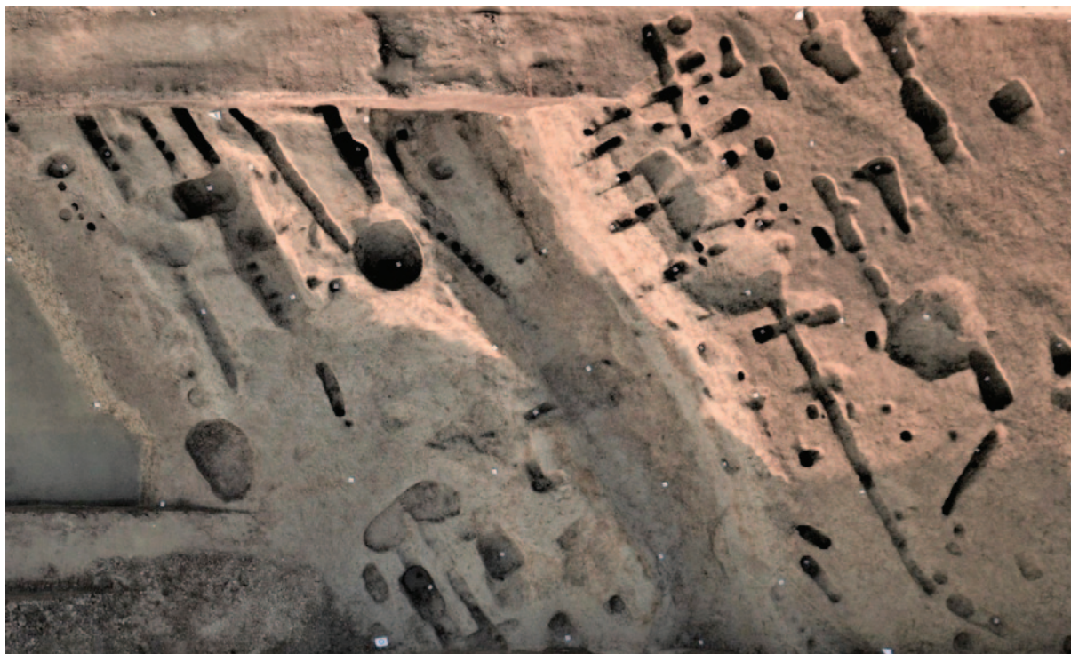
Sl. 5 Pogled na opkop s ostacima fortifikacijskih elemenata i palisadama na zapadnome dijelu lokaliteta

Od devet objekata, pet ih ima značajke stambene arhitekture (objekti 6, 7, 9, 11 i 12), a otkriveni su na