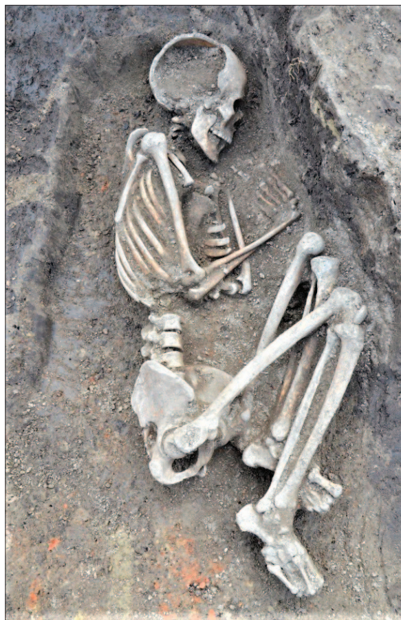
Sl. 9 Ljudski kostur u zgrčenome položaju, grob 2