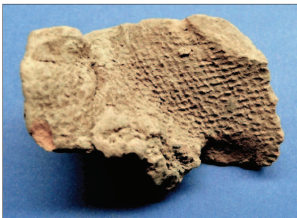
Sl. 13 Otisak tkanine na glini

Fig. 13 Imprint of fabric on clay