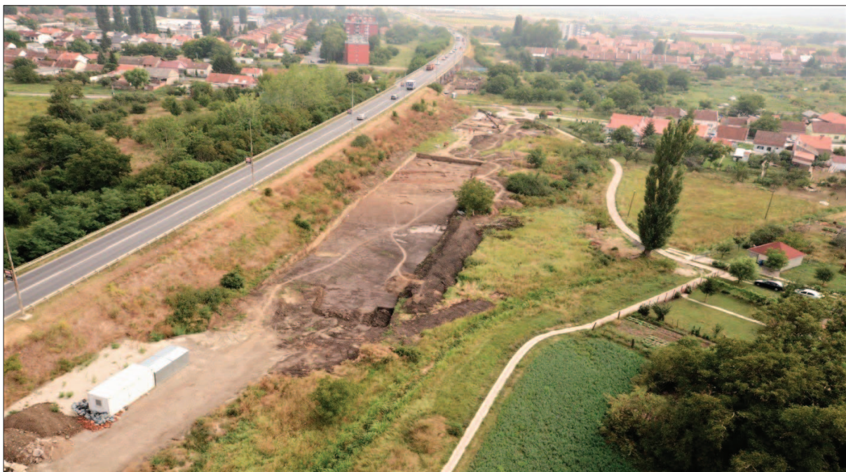
Sl. 2 Pogled prema istoku na površinu istraživanja uz nasip južne obilaznice grada Osijeka