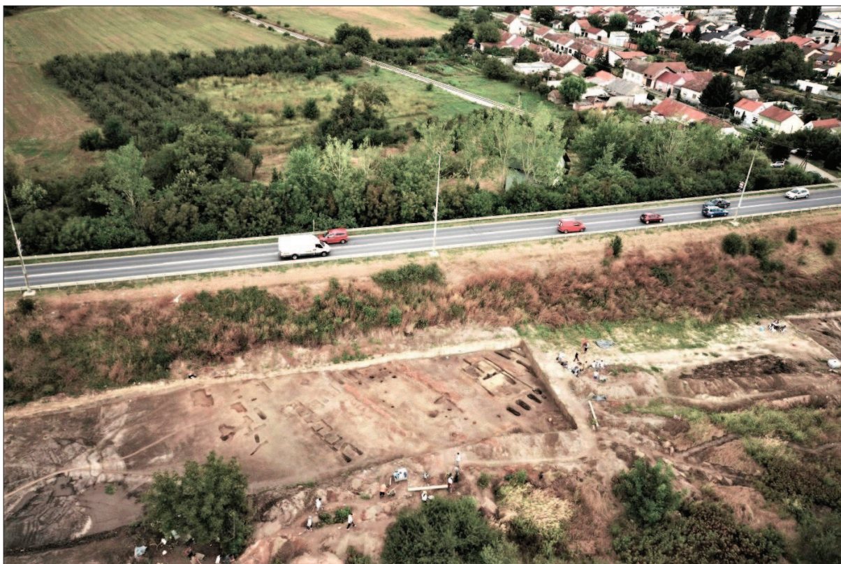
Sl. 7 Pogled iz zraka na brežuljak Hermanov vinograd presječen južnom osječkom obilaznicom i na objekte 6, 7, 9 i 12