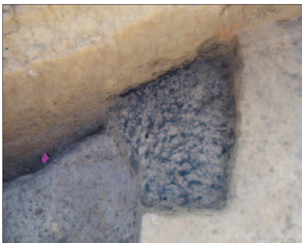
Sl. 12 Ostaci paljevinskoga groba i jama koja ga je presjekla u istočnome rovu

Fig. 11 The pit that partly intersected the fill of the chamber with the carriage