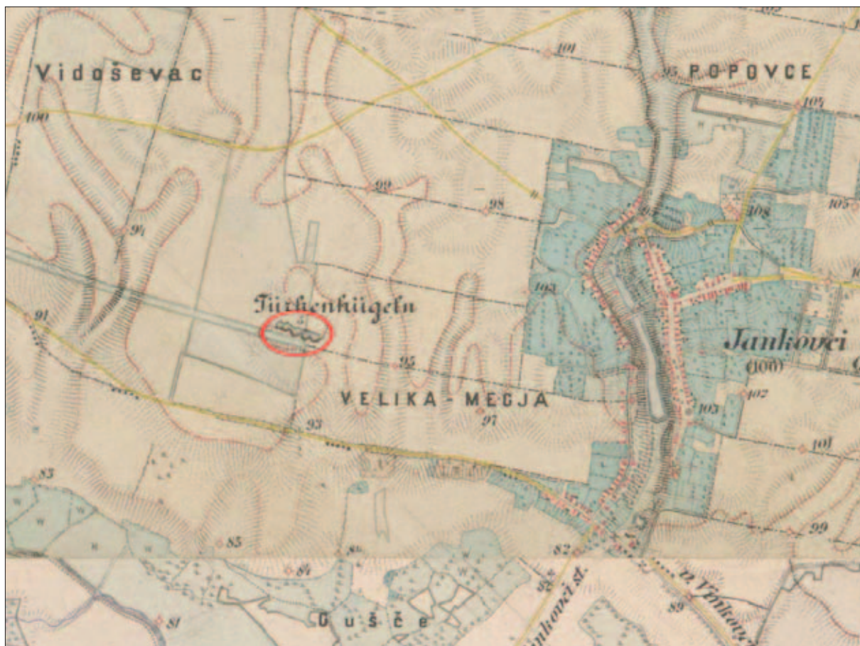
Sl. 1 Karta iz 19. stoljeća s pet dokumentiranih tumula (izradio: H. Vulić)

rimski novci (Ljubić 1880: 94). Tumule kod Starih Jankovaca potom spominje J. Brunšmid, no po njegovome opisu dva tumula nalaze se u polju, a tri su u šumi te ih datira u mjedeno doba (Brunšmid 1888: 71). Š. Ljubić ih još jednom spominje 1889. godine kada opisuje neke od nalaza – ulomak olovne ploče, dio željeznoga obruča te ulomke keramičkih posuda (Ljubić 1889: 163). 1 Tumuli nakon toga padaju u zaborav. Spominju ih tek Z. Vinski i K. Vinski-Gasparini 1962. godine kada navode sva poznata nalazišta u međurječju Save i Drave na kojima je zabilježeno postojanje tumula te ih okvirno povezuju s poznatim stariježeljeznodobnim tumulima s prostora sje-