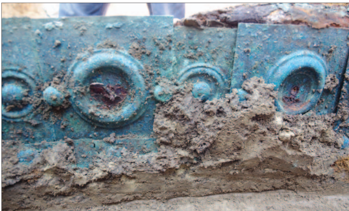
Sl. 18 Elementi straųnje bronĳane ukrasne oplate dvokolice

Fig. 17 The hackamore of the northern horse, type Taylor 5/Ortisi III.B.2