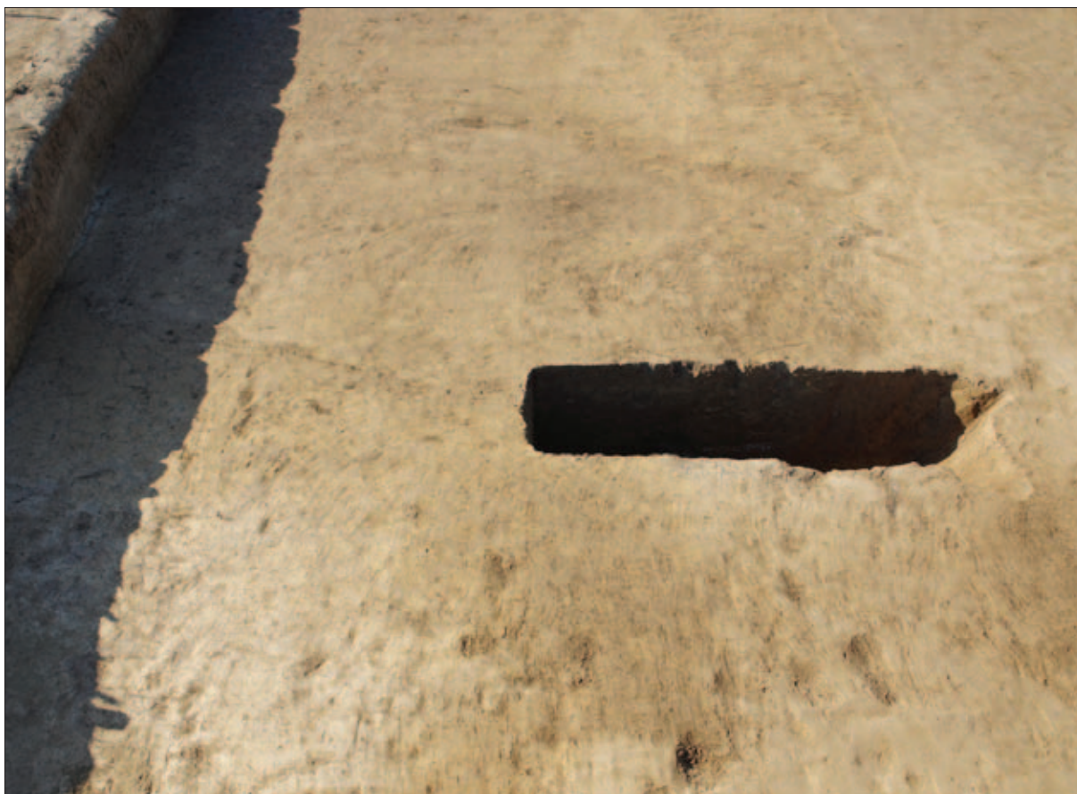
Sl. 11 Ukop jame koja je dijelom zahvatila zapunu komore s kočijom

Fig. 11 The pit that partly intersected the fill of the chamber with the carriage