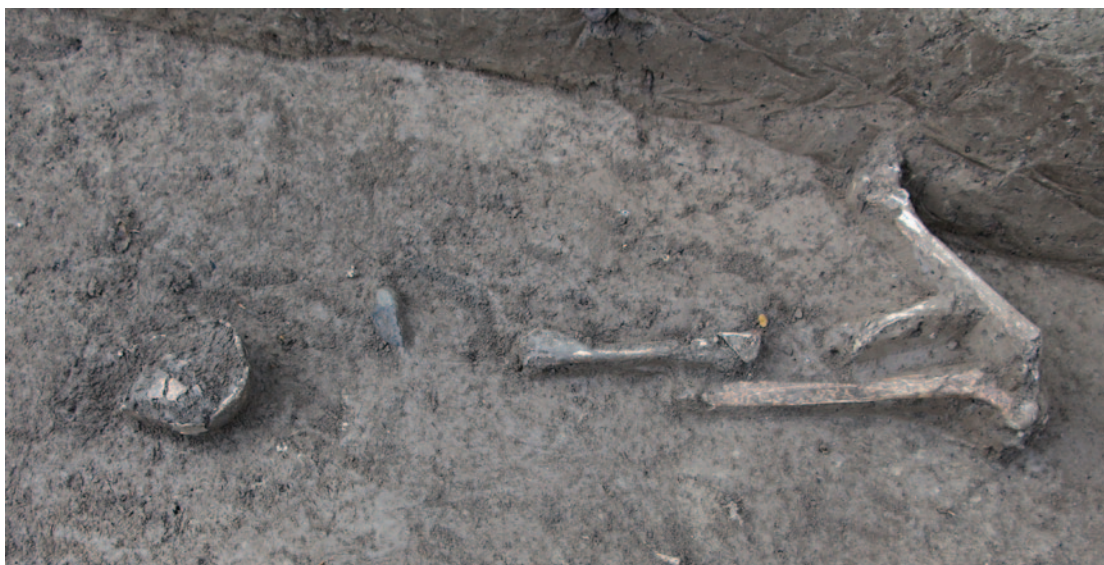
Sl. 5 Nalazi ljudskih ostataka i keramičkih ulomaka u gornjem dijelu ukopa groba 7