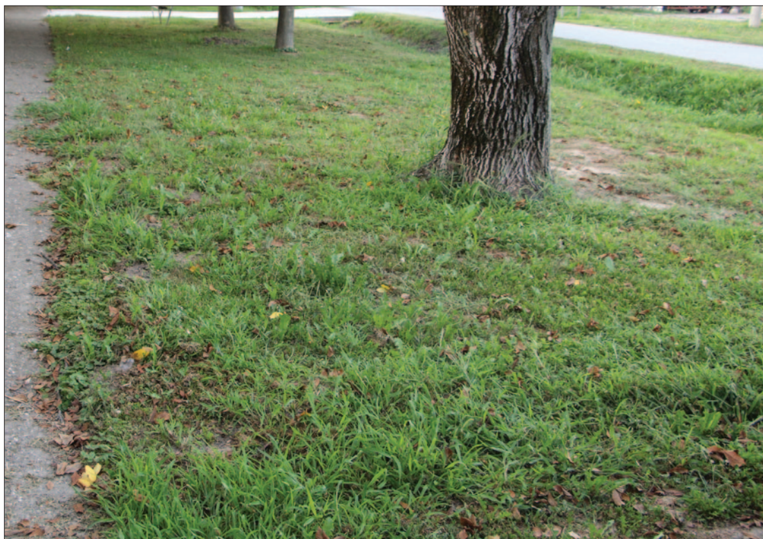
Sl. 4 Položaj sonde 8 u Ulici A. Starčevića br. 16