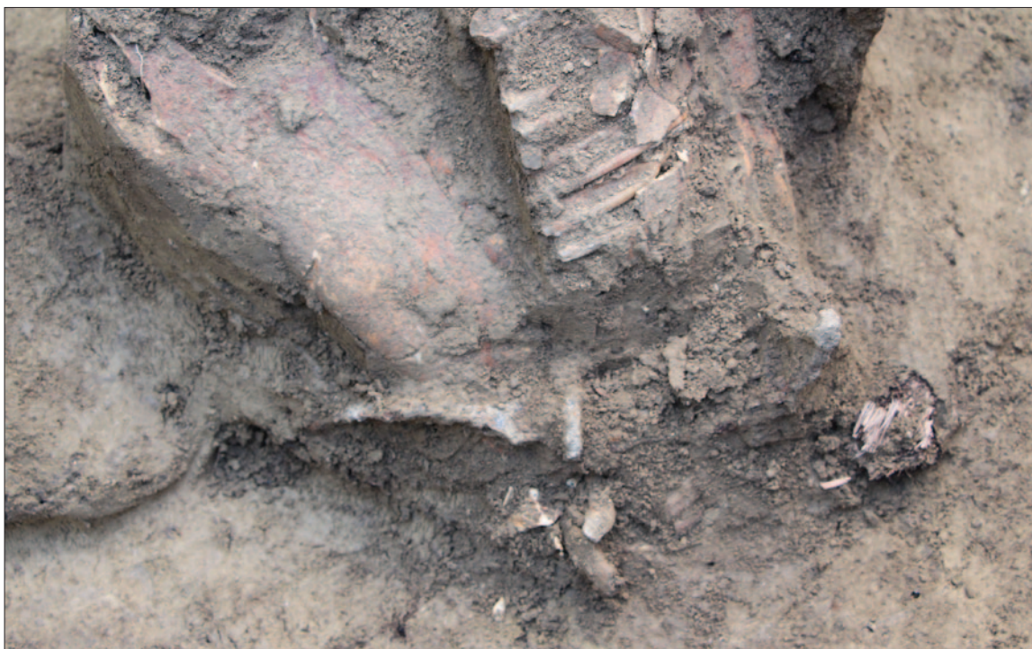
Sl. 10 Detalj ukopa konja br. 6 sa željeznim žvalama

Narukvice poput onih iz groba 5 u Lovasu izdvojene su kao tip BR-B6 koji je datiran u LT B2c, a odlikuju se gusto postavljenim zadebljanjima, dok se na krajevima nalaze nešto veća zadebljanja koja se dodiruju (Bujna