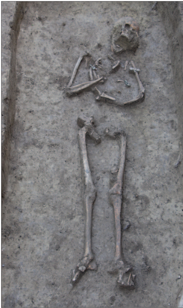
Sl. 6 Kasnohalštatski kosturni grob 7