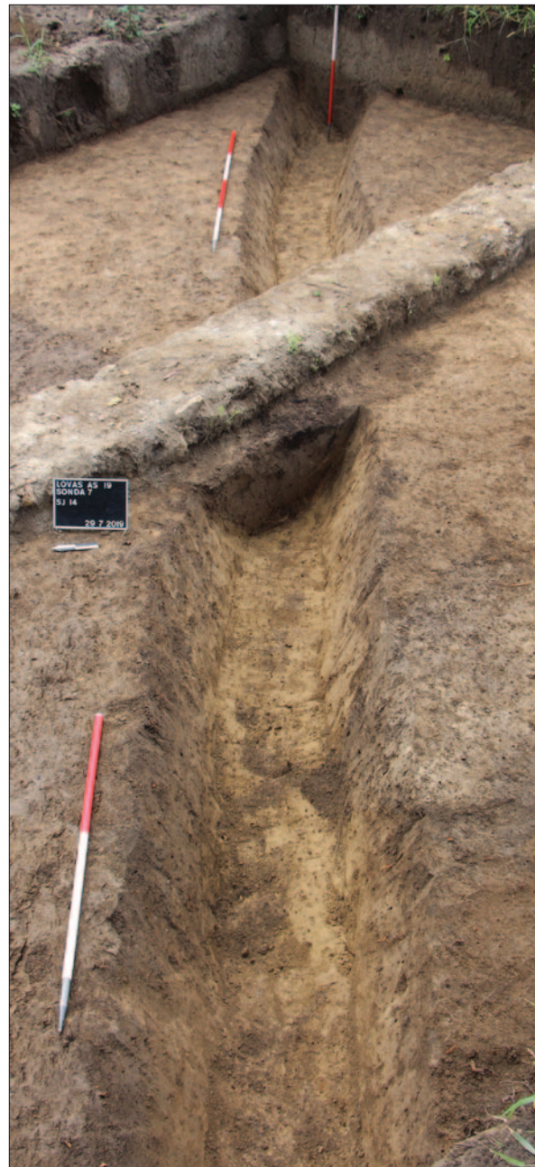
Sl. 3 Ukop jarka SJ 14 u sondi 7

Fig. 3 A ditch SU 14 in Trench 7