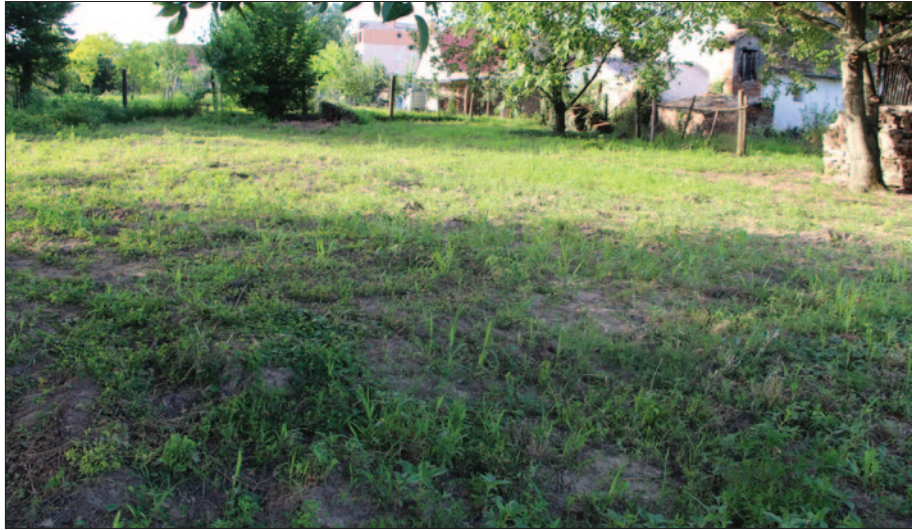
Sl. 2 Položaj sonde 7 u vrtu kuće br. 16 u Ulici A. Starčevića

Fig. 2 Position of Trench 7 in the garden of 16 A. Starčević Street