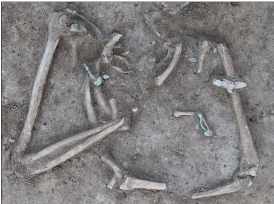
Sl. 7 Detalj kosturnoga groba 7

Usporedbe za grob 5 predstavljaju ranolatenski ženski kosturni grobovi 63 i 67 s Karaburme koji imaju orijentaciju zapad – istok, odnosno istok – zapad, pri čemu su ruke kod oba spomenuta groba pokojnice imale položene uz tijelo (Todorović 1972: 26, 28, T. XLII: 2–3; Ljuština, Spasić 2012: 368–369, Fig. 2). Brončane fibule s niskim žičanim lukom, kratkom nožicom na kojoj se nalazi mala kuglica i spiralom s navojima koji su povezani iznutra smatraju se karakterističnim oblikom LT C1 (Božić 1981: 319, T. 2: 26). Tada se datira paljevinski grob 28