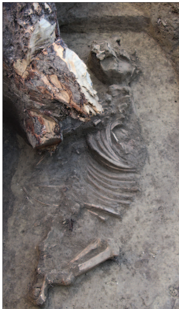
Sl. 9 Ukop konja br. 6

Fig. 8 Detail of the Early La Tène inhumation grave 5