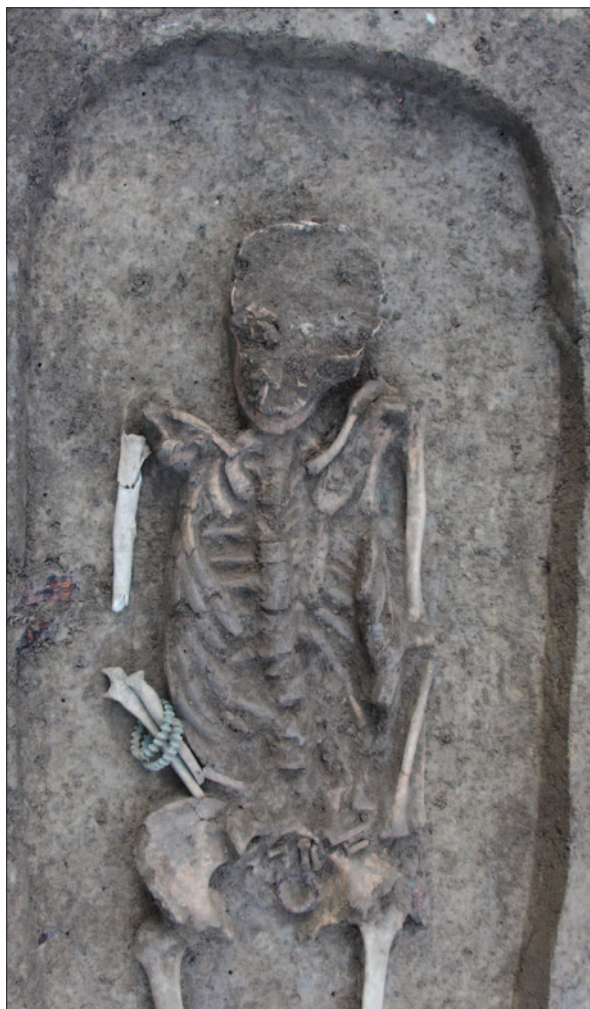
Sl. 8 Detalj ranolatenskoga kosturnog groba 5

Posebno zanimljiv nalaz u grobu 5 predstavlja 135 malih staklenih perli ovalnoga oblika i najčešće tamnoplave boje. U ženskome grobu 63 na Karaburmi iz LT B2 oko vrata pokojnice pronađeno je sedam ovalnih staklenih perli tamnoplave, oker i svijetložute boje promjera od 0,2 do 0,7 cm (Todorović 1972: 27, T. XXII: 5; Ljuština, Spasić 2012: 369, Pl. 1: 4). S druge strane, u istovremene grobu 67, oko vrata pokojnice, nalazilo se 25 malih bikoničnih plavih perli (Todorović 1972: 28, T. XXV: 5; Ljuština, Spasić 2012: 369, Pl. 1: 7), kakve su pronađene i u nešto starijem grobu 7 u Lovasu. S groblja u Kupinovu također potječe 25 kobaltnoplavih staklenih perli nepravilnoga kuglastog oblika (Drnić 2015: 94, sl. 25: 1, T. 39: 1), dok su iz Dalja poznate kobaltnoplave, svijetloplave te oker staklene perle (Drnić 2015: 94, sl. 25: 3). U grobu 7 u Osijeku pronađeno je četrnaest staklenih perli bikoničnoga oblika od tamnomodroga stakla (Spajić 1954: 12), dok su u grobu 11 pronađene bikonične staklene perle –