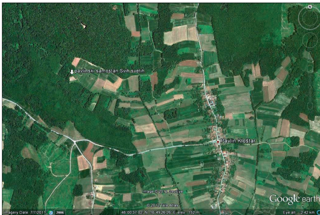
Karta 1 Položaj pavlinskog samostana Svih svetih

Horvat 1989: 100; Kožul 1999: 14, 36, 42, 55, 59–60, 63, 88; Horvat 2003: 145–160).