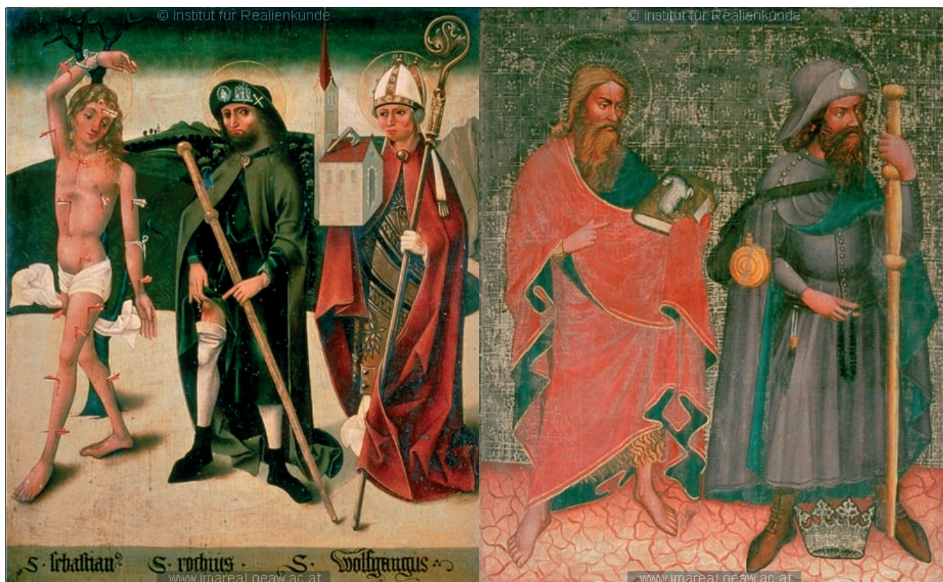
Sl. 1 a) sv. Sebastijan, sv. Rok kao hodočasnik i sv. Wolfgang, Bad Aussee, oko 1475. – 1485.; b) sv. Ivan Krstitelj i sv. Jodok (Jošt), oko 1425. – 1435. – način nošenja hodočasničkih oznaka; fotografije preuzete s mrežne stranice http://tarvos.imareal.oeaw.ac.at (ožujak 2013.)