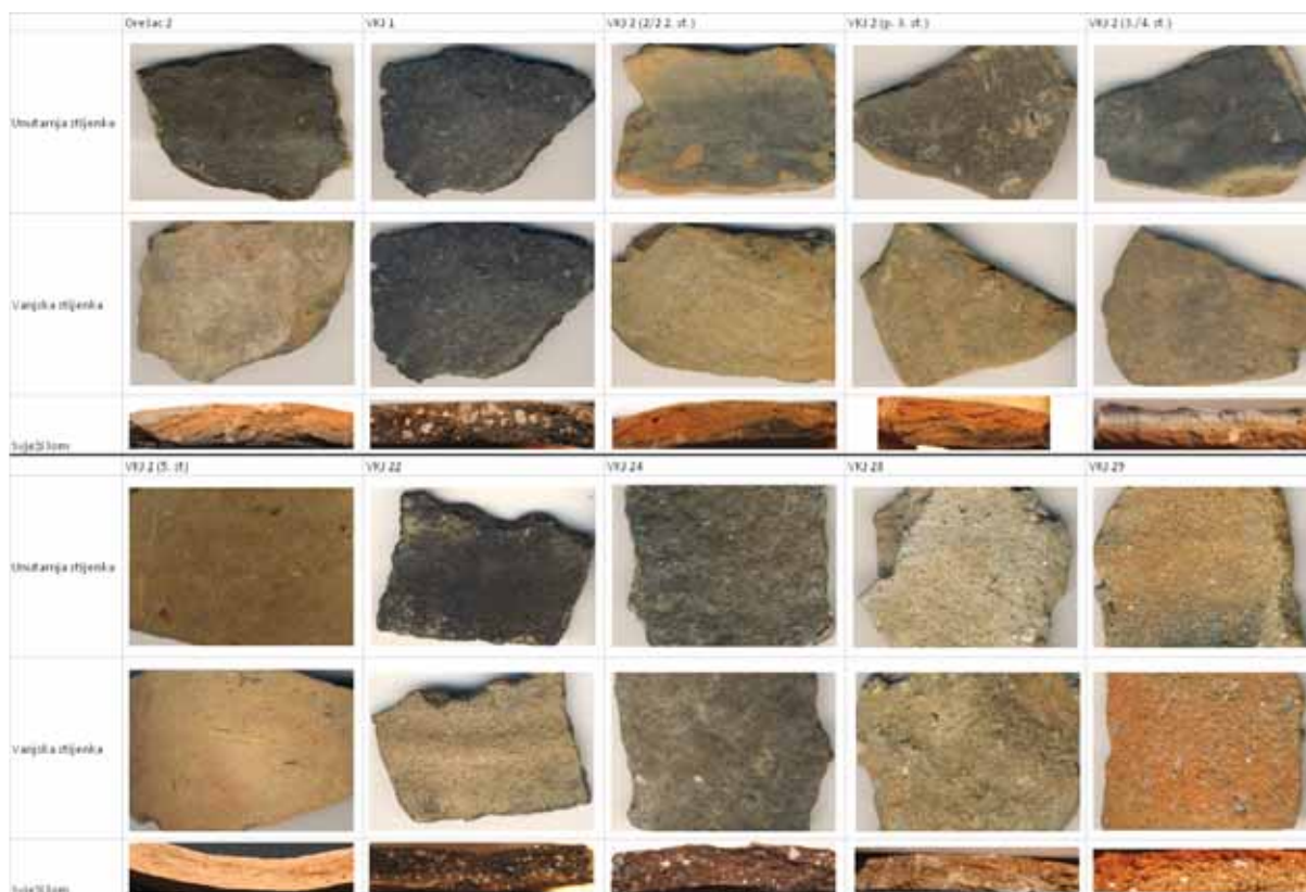
Tablica 2 Strukture keramike s lokaliteta Virovitica – Kiškorija jug i Orešac Table 2 Structure of ceramics from the sites Virovitica – Kiškorija South and Orešac

izdvajaju u zasebnu sredinu, često s njemu susjednim lokalitetima. U takvim mikroregijama uočavaju se strukturalne, tehnološke, tipološke i dekorativne podudarnosti u uporabnoj keramici lokalne proizvodnje (Jelinčić 2009a: 221-234, T. 1-153).