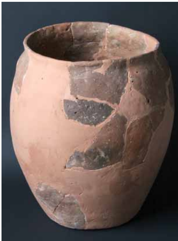
Sl. 3 Lonac, tip 1.1 (rekonstrukcija: M. Vuković Biruš)