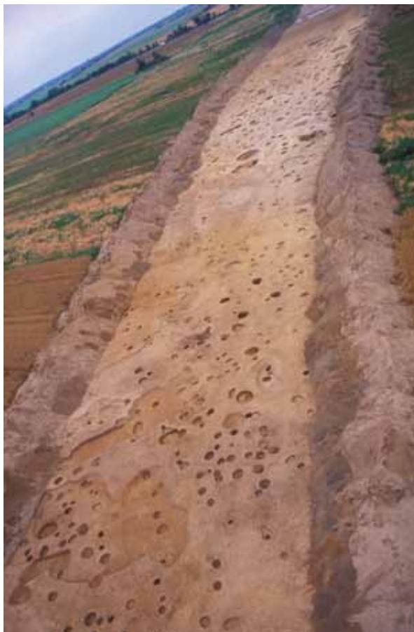
Sl. 1 Pogled na južni dio lokaliteta Virovitica – Kiškorija jug 2005. godine

Fig. 1 View of the southern part of the site Virovitica – Kiškorija South in 2005