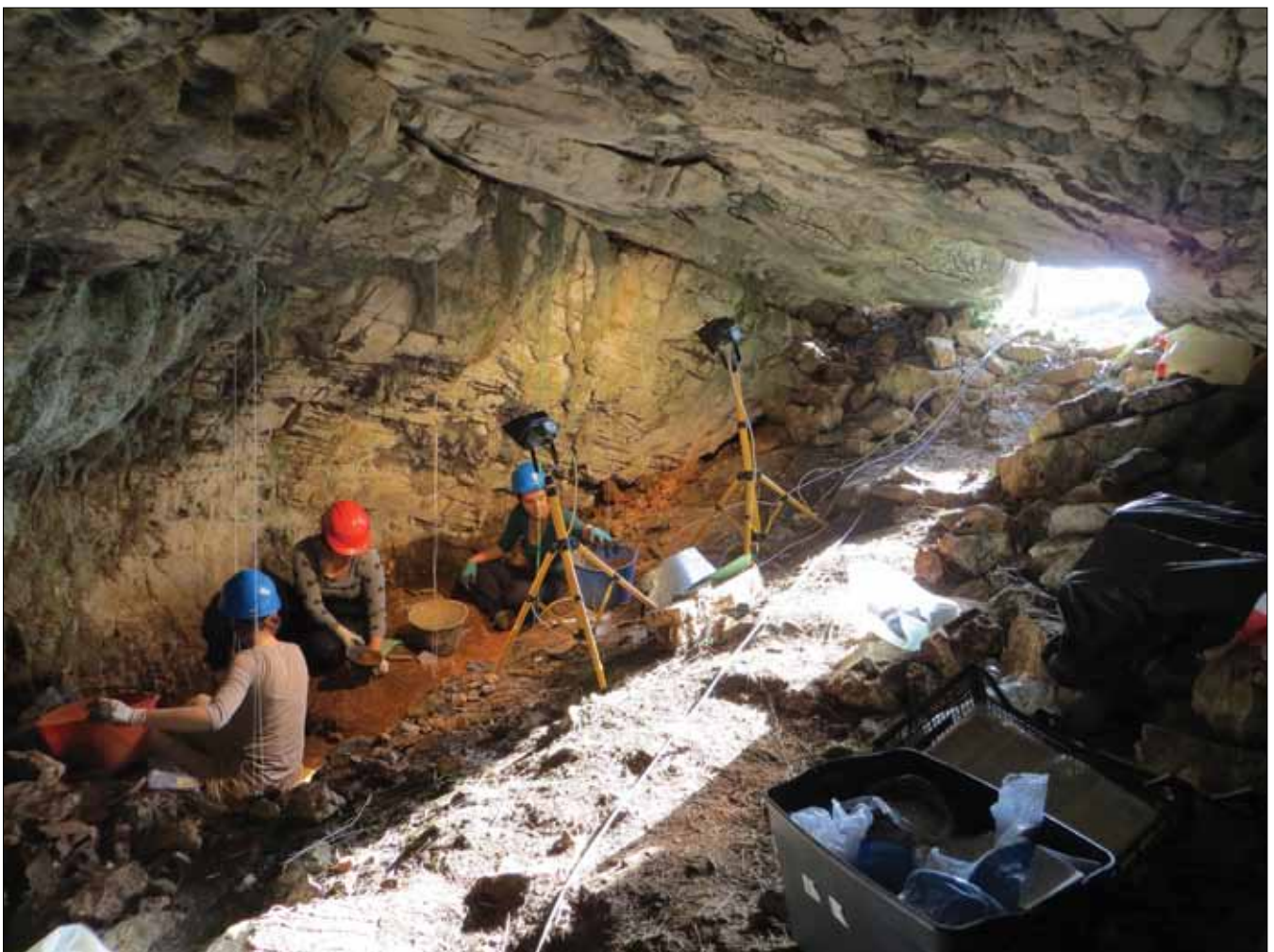
Sl. 9 Rad u sondi kod ulaza u Velikoj pećini u Kličevici 2014. Fig. 9 Work in the trench at the entrance to Velika pećina in Kličevica in 2014