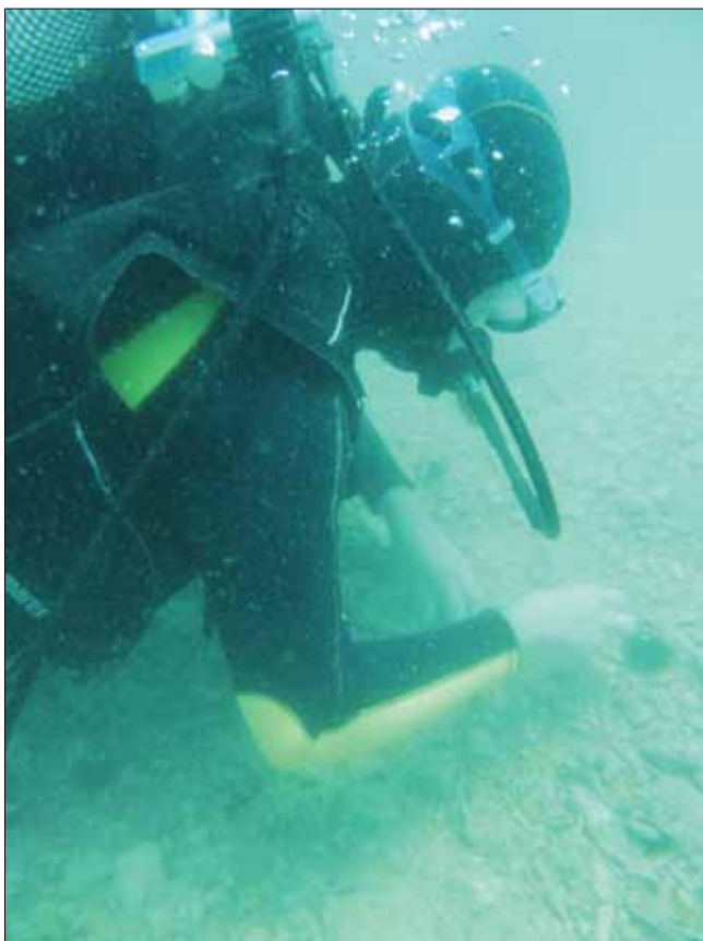
Sl. 7 Podvodno rekognosciranje s prikupljanjem površinskog materijala (rožnjaka) koji sličili na artefakte

Od 1. do 6. lipnja 2015. izvršena su istraživanja podvodnoga paleolitičkog nalazišta Kaštel Štafilić – Resnik. Izvršeno je podvodno rekognosciranje s prikupljanjem materijala na području gdje se pojavljuju litički nalazi iz srednjeg paleolitika (sl. 7), kao nastavak dosadašnjih istraživanja (2008.; 2010.–2015.). Primijenjena je nova metodologija rada na ovom lokalitetu (s obzirom na to da se ove godine rekognosciralo), pri kojoj se koristio GPS. Uređaj se nalazio na manjoj platformi na površini, a konopcem ga je vukao jedan od ronilaca. Tako je zabilježena točna trasa rekognosciranja. Prikupljeni su rožnjaci koji su sličili na artefakte. Početak pretraživanja morskog dna išao je u smjeru 248 (u smjeru Trogira) počevši od mjesta na kojem je bilo mrežište tijekom prethodnih sezona istraživanja. Dužina rekognosciranja bila je 130 m na uobičajenoj dubini (između 3 i 4 m). Četiri su ronionci bila pozicionirana jedan do drugoga, ukupno desetak metara u