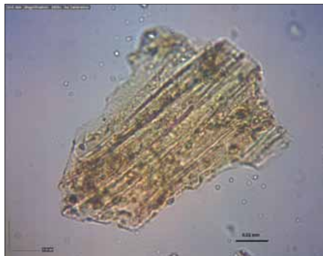
Sl. 5 i 6 Mikroskopski preparat s izdvojenim zrnima vulkanskog stakla iz sloja tefre veličine do 50 mikrona (DIV-2) – smeđa zrna s paralelnim crnim crtama Fig. 5 and 6 Microscopic sample with grains of volcanic glass from the tephra layer up to 50 microns big (DIV-2) brown grains with parallel black lines

nizacije, područje južno od Plana nije bušeno. Detaljno su opisani i uzorkovani profili (DIV-1 i DIV-2) aluvijalnih naslaga koji u sebi sadrže proslojke crvenih paleotala (debljine do 20 cm; sl. 3). Na profilu DIV-2 osim aluvijalnih (holocenskih naslaga) s klastima krednih vapnenaca i proslojcima crvenih paleotala, utvrđen je i isprekidan sloj starijih paleotala koja su razvijena na eocenskim flišnim naslagama. Ovaj sloj paleotala nije prisutan kontinuirano nego na većini pregledanih profila nedostaje i aluvijalne (holocenske?) naslage neposredno leže na naslagama fliša. Pri dnu izdanka s paleotlom razvijenim na flišu utvrđeno je postojanje izdužene leće tefre žuto-narančaste boje debljine do 8 cm i ukupne dužine od 4 m (sl. 4, 5 i 6).