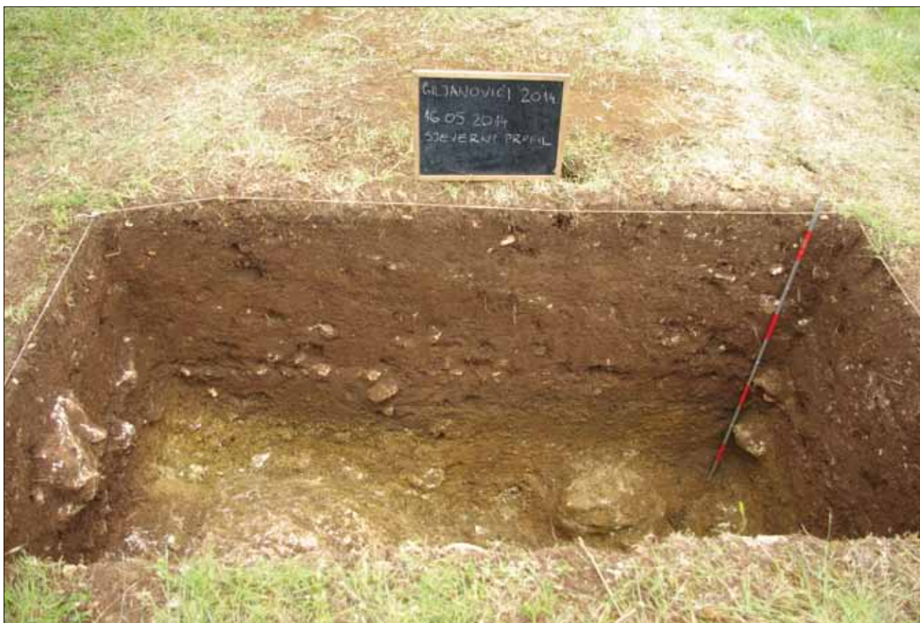
Sl. 2 Profil sonde na nalazištu Giljanovići (Karanušići) Fig. 2 A profile of the trench at Giljanovići (Karanušići)

Arheološki nalazi pronađeni su samo u SJ 1. Zbog debljine (oko 70 cm) SJ 1 arbitrarno je podijeljena na četiri dijela (SJ 1.1 – SJ 1.4) prosječne debljine od 15 do 20 cm.