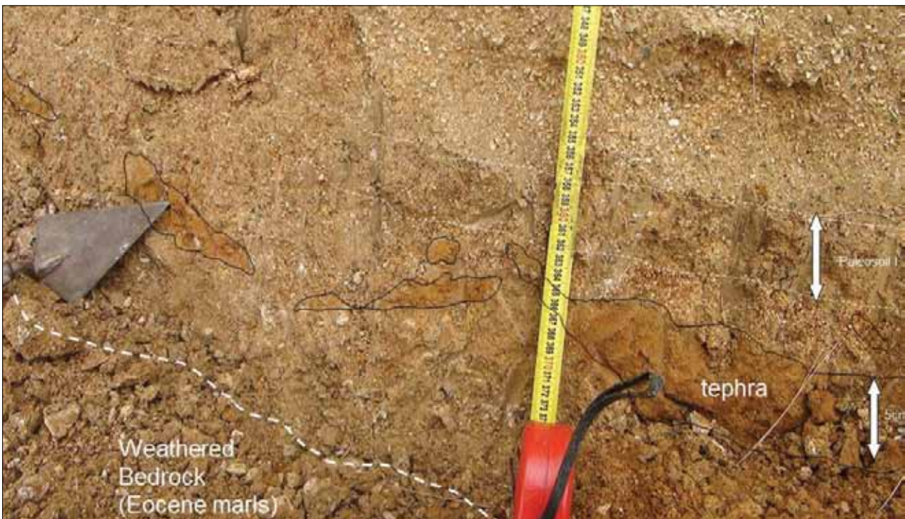
Sl. 4 Detaljni prikaz tefre unutar profila paleotla (DIV-2)