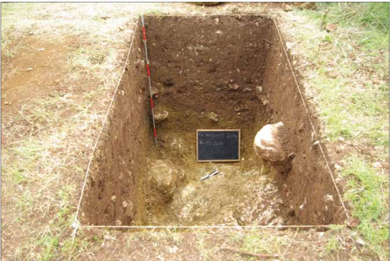
Sl. 1 Dovršena sonda na nalazištu Giljanovići (Karanušići) Fig. 1 The completed sondage at Giljanovići (Karanušići)

Test archaeological excavations were carried out in a