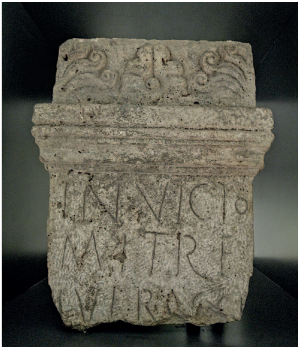
Fig. 1 Mithraic altar from Borovo, Vukovar City Museum inv. no. AZ-550 (Archive of Vukovar City Museum) Sl. 1 Mitrin žrtvenik iz Borova, Gradski muzej Vukovar, inv. br. AZ-550 (Arhiv Gradskoga muzeja Vukovar)

Izrađen je od vapnenca (dimenzije 42 x 33 x 21,5 cm) i nažalost je oštećen. Donji je dio odlomljen i izgubljen. Na sačuvanom dijelu, iznad natpisnoga polja, dekoracija je koja se sastoji od jednostavnih cvjetnih motiva: u sredini je palmeta, a s obje strane zatvaraju je dva niza od po tri volute ili vitice. Ispod ukrasa peterodijelno je gređe. Saču-vana su samo tri retka natpisa: