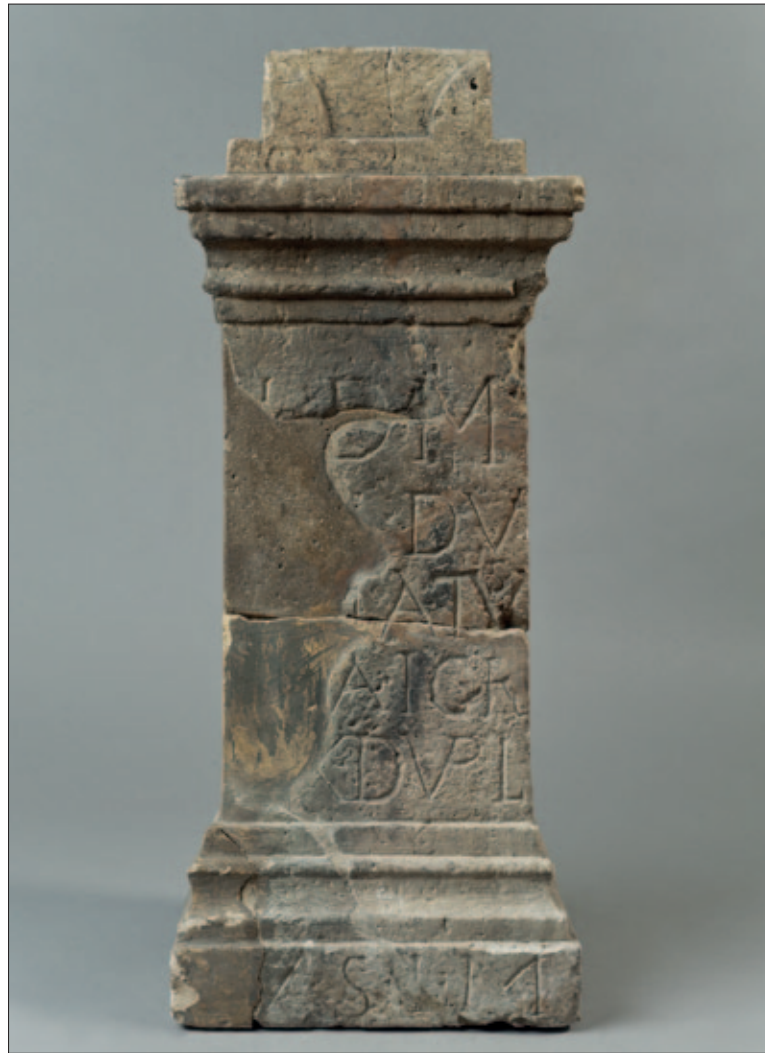
Fig. 2 Mithraic altar from Dalj, Archaeological Museum in Zagreb, inv. no. 742

Sl. 2 Mitrin žrtvenik iz Dalja, Arheološki muzej u Zagrebu, inv. br. 742