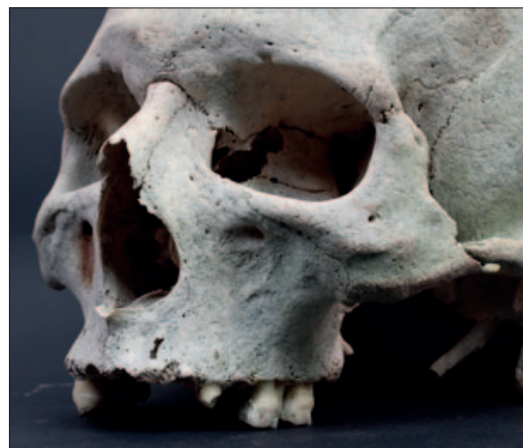
Sl. 2 Blago proširenje nosne šupljine na lubanji iz groba 1

Fig. 1 Bilateral thinning of parietal bones on the skull from grave 1