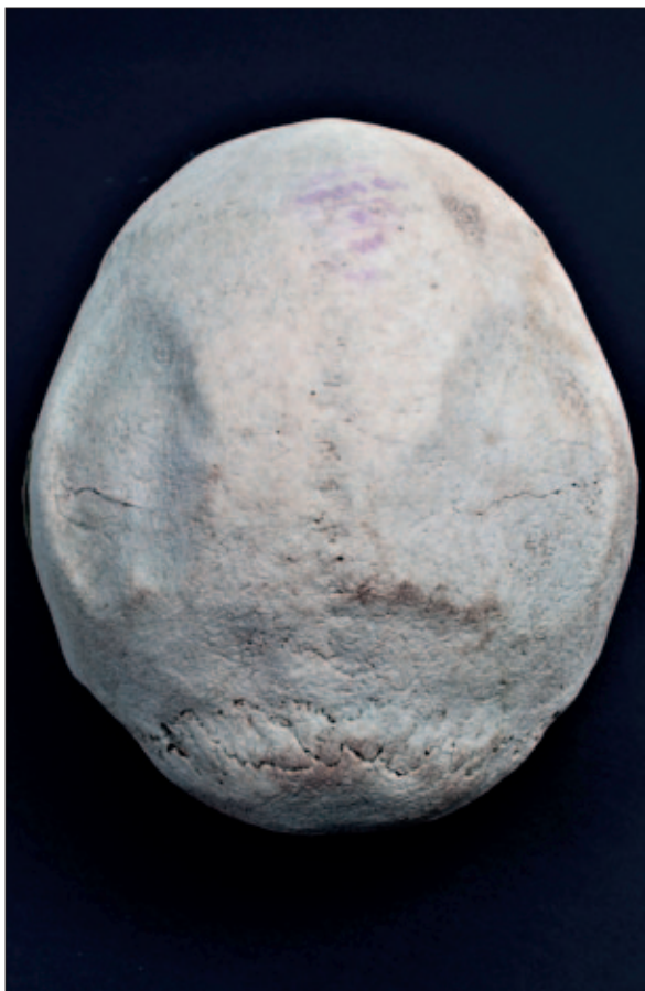
Sl. 1 Bilateralno stanjšavanje tjemenih kostiju na lubanji iz groba 1

U grobu broj 1 pronađeni su ostaci muškarca starosti u trenutku smrti između 40 i 50 godina. Na posteriornom dijelu tjemenih kostiju uočene su plitke udubine na ektokranijalnoj strani. Udubine se pojavljuju bilateralno i simetrične su na obje kosti (sl. 1). Na gornjoj čeljusti uočene su patološke promjene koje se povezuju s leprom. Na području nosnog otvora uočeno je blago proširenje (sl. 2). Zahvaćeno je područje dimenzija 2,2 cm na lijevoj i 2,1 cm na desnoj strani gornje čeljusti na području oko nosnog otvora, a na kosti oko proširenja uočen je porozitet. Na postkranijalnom dijelu kostura prisutan je jaki oblik degenerativnog osteoartritisa na što upućuju osteofiti uočeni na području oba ramena zgloba, na sternalnim krajevima ključnih kostiju,