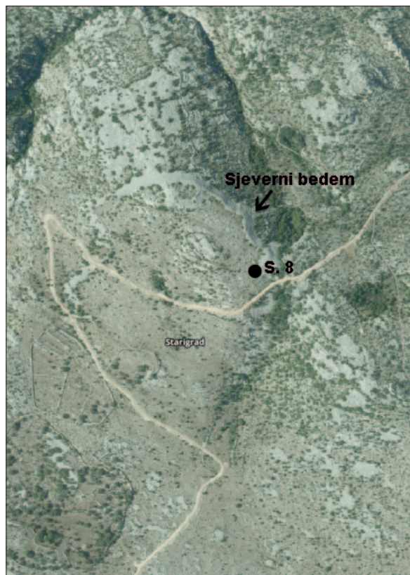
Sl. 2 Pozicija sonde 8 istražene 2014. godine (modificirano prema: Geoporttal DGU).

Najlošije očuvani ulomak (sl. 3: 4 – težina ulomka: 83 g) mogao je pripadati utegu valjkastog oblika s proširenim krajem slično drugome, bolje očuvanome